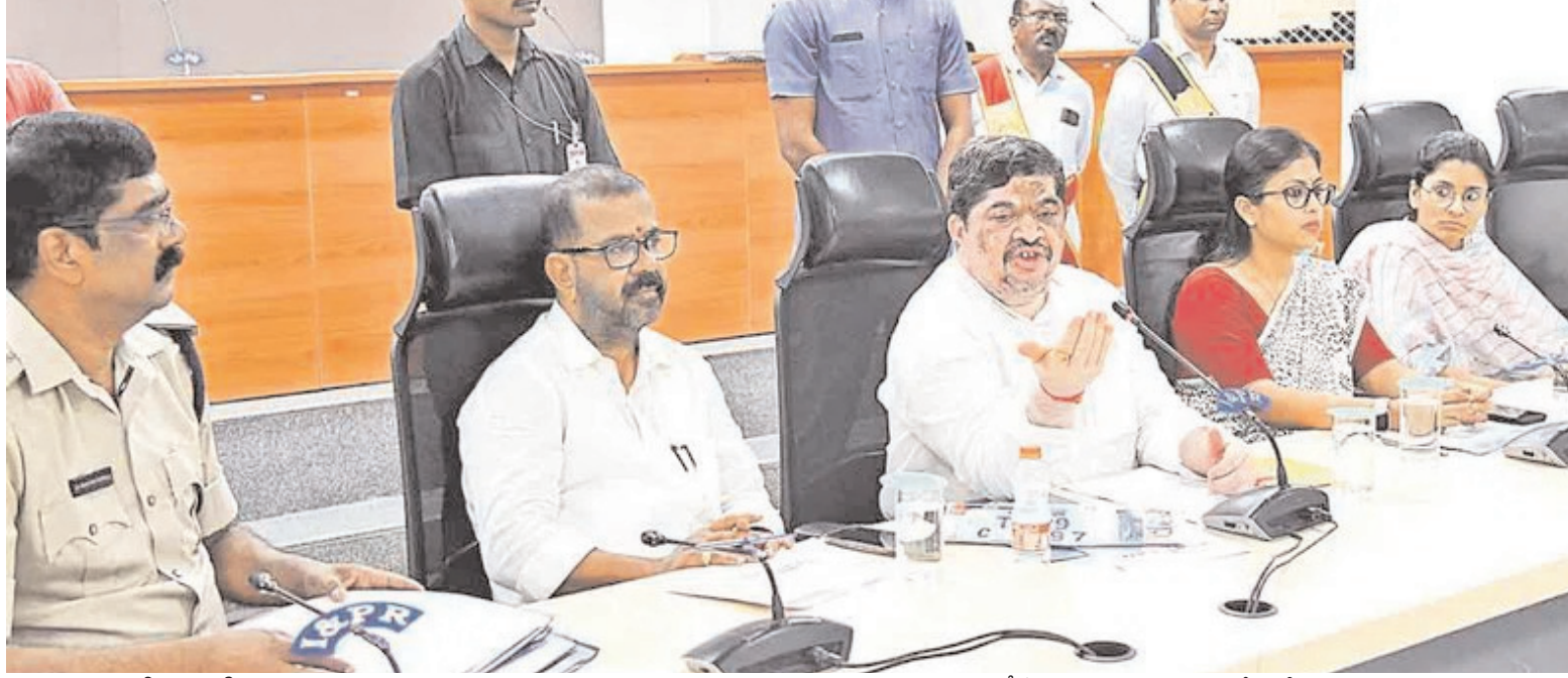
వాహన రిజిస్ట్రేషన్లో మార్పు