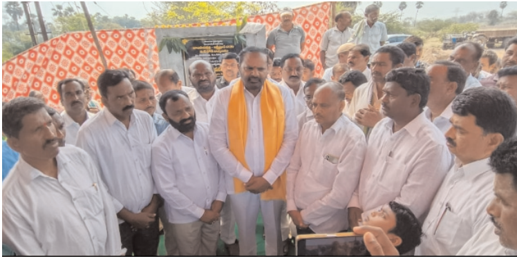
ఓదెల/ పెద్దపల్లి మార్చి 14(అక్షరం స్యూస్)