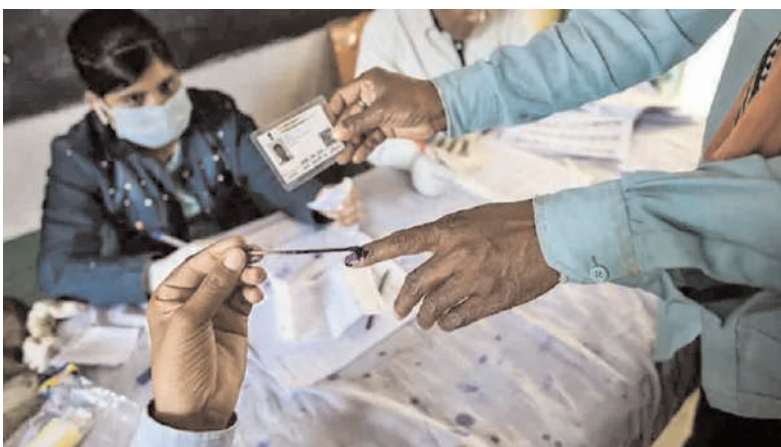
వచ్చే గురు లేదా శుక్రవారం లోక్సభ ఎన్నికల షెడ్యూల్ విడుదలయ్యే అవకాశం ఉంది. ఎన్నికల నిర్వహణకు సంబంధించి పరిశీలన కోసం కేంద్ర ఎన్నికల సంఘం సోమవారం జమ్ముకశ్మీర్కు వెళ్తుంది. సోమవారం నుంచి బుధవారం కేంద్ర ఎన్నికల బృందం జమ్ముకశ్మీర్లో పర్యటించనుంది.

బుధవారం జమ్ముకశ్మీర్ పర్యటన ముగియగానే గురు లేదా శుక్రవారం ఎన్నికల సంఘం లోక్సభ ఎన్నికల షెడ్యూల్ను విడుదల చేసే అవకాశం ఉంది.