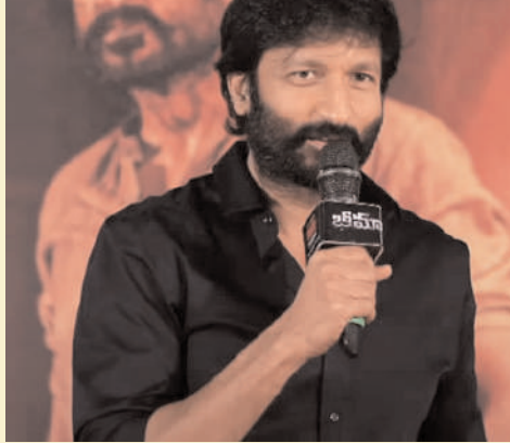
హైదరాబాద్, మార్చి9 (అక్షరంస్పెషల్)