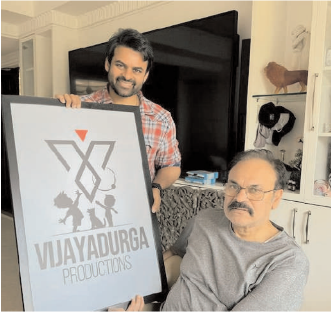
హైదరాబాద్, మార్చి9 (అక్షరంస్పెషల్)