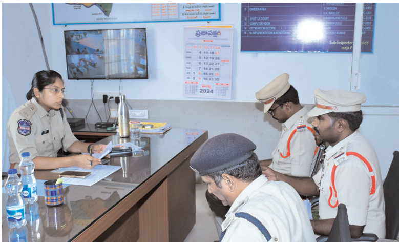
గద్వాల జిల్లా/అయిజ మండల/మార్చి 13/అక్షరం స్యూస్:-