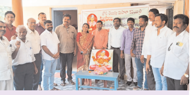
భమ్మం/ వైరా మార్చి 13 (అక్షరం స్యూస్)