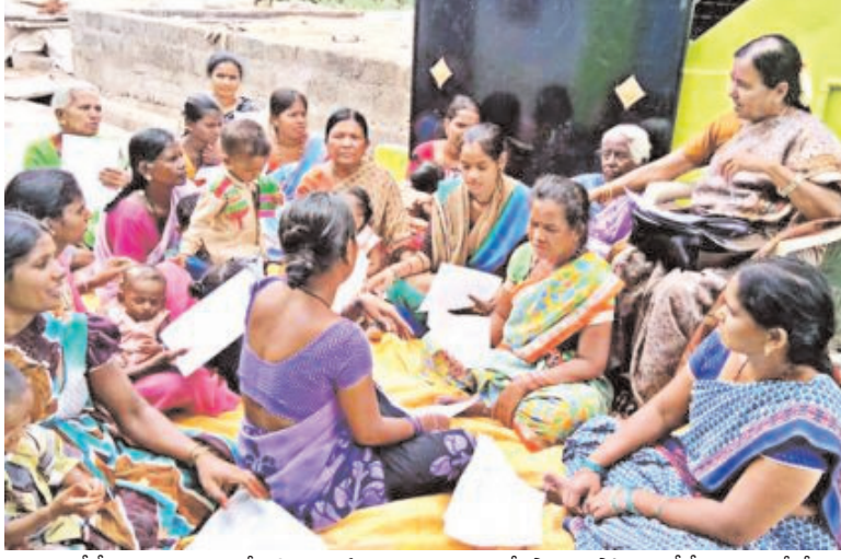
బాధ్యులైన సీసీలపై విచారణ చేపట్టి, 10 ఏళ్లుగా మండలంలో పాతుకుపోయిన సీసీలపై బదిలీవేటు వేయాలని మండలంలోని ప్రజలు ముక్తకంఠంతో కోరుతున్నారు.

రాజన్న సిరిసిల్ల /వేములవాడ, మార్చి - 13 (అక్షరం స్టూన్): వేములవాడ నియోజకవర్గం కోనరావుపేట మండలంలో పొడుపు మహిళా సంఘాల (ద్వారా) పనితీరును పరిశీలించాల్సిన అధికారాలైన సీసీల బదిలీలు లేక 10 ఏళ్లుగా గడుస్తున్న జిల్లా యంత్రాంగం చూసి చూడనట్టు వ్యవహారిస్తున్న జిల్లా యంత్రాంగం. సీసీలు చేసే పనిని గ్రామంలో ఉన్న వివేచిల ద్వారా చేపిస్తూ సీసీలు జీతాన్ని పొందుతున్నారు. సీసీల లాగిన్ లో విడివిడి లతో పని చేపిస్తున్నారు. దబ్బాలు ఇస్తేనే వారితో దోస్తీ లేదంటే శత్రుత్వమే, వివేచిల సంఘం యొక్క సమావేశాలు, గ్రామ సంఘం యొక్క సమావేశాలు, ఉన్నతాధికారులు ఆదేశిస్తే చేసే పనులకు మండలంలో జరిగే వివిధ మీటింగ్ లకు హాజరవుతూ సీసీల పనులు కూడా వివేచిల ద్వారా చేపిస్తూ వేధిస్తున్నారు. సీసీల బదిలీలు లేకపోవడంతో వారు ఆదండి ఆట పాడింది పాటగా మండలంలో కోనసాగుకోంది.. ఇప్పటికైనా ఉన్నతాధికారులు ఈ విషయంపై విచారణ చేపట్టి