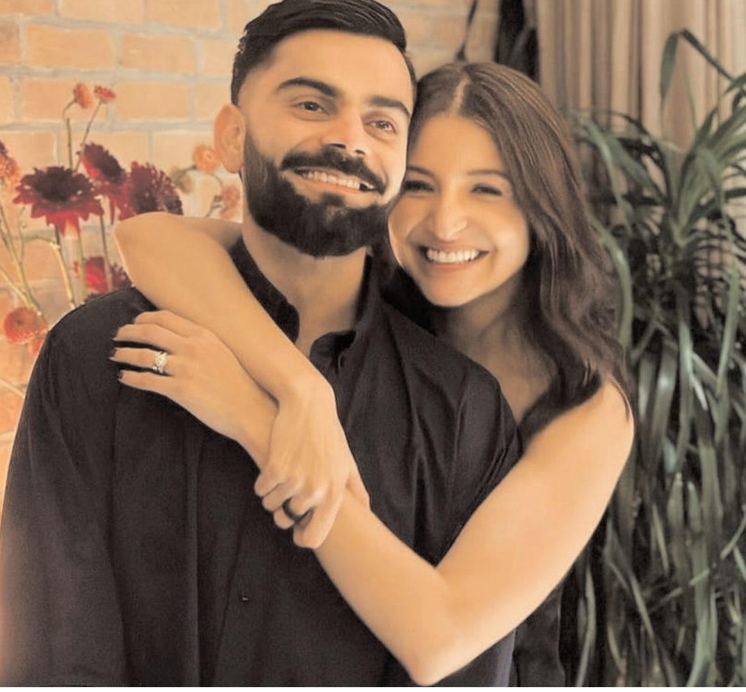
అర్థం అందరూ వెతుకుతున్నారు. కానీ ఈ పేరు చూడాలి. అనుష్క, విరాట్ ల వివాహం 2017లో తామెండుకు పెట్టామో వారే తరువాత వివరణ ఇస్తారేమో జరిగింది.