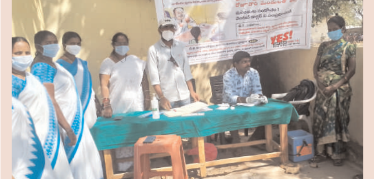
ఖమ్మం/ తల్లాడ ఫిబ్రవరి 21 (అక్షరం న్యూస్)