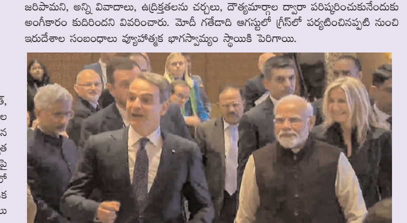
జరిపామని, అన్ని వివాదాలు, ఉద్రిక్తతలను చర్చలు, దౌత్యమార్గాల ద్వారా పరిష్కరించుకునేందుకు అంగీకారం కుదిరిందని వివరించారు. మోడీ గతేడాది అగస్టులో గ్రీన్ లో పర్యటించినప్పటి నుంచి ఇరుదేశాల సంబంధాలు వ్యూహాత్మక భాగస్వామ్యం స్థాయికి పెరిగాయి.

న్యూఢిల్లీ, ఫిబ్రవరి 21: ఆయుధ సంపత్తి తయారీ, అభివృద్ధి కోసం కలిసి పనిచేసేందుకు భారత్, గ్రీన్ దేశాలు అంగీకారానికి వచ్చాయి. గ్రీన్ ప్రధాని కిరియాకోస్ మిట్సోటాకీస్ రెండు రోజుల పర్యటన నిమిత్తం బుధవారం ఢిల్లీకి విచ్చేశారు. తొలుత రాజ్ భూట్ లో మహాత్మా గాంధీకి ఆయన నివాళి అర్పించారు. అనంతరం రాష్ట్రపతి భవన్ లో ఆయనకు ఘనస్వాగతం లభించింది. తర్వాత ప్రధాని సరేంద్ర మోడీతో ఆయన ద్వైపాక్షిక చర్చలు జరిపారు. సాధ్యమైనంత త్వరగా వలసలపై ఇరుదేశాలు ఒప్పందం చేసుకోవాలని ఈ సమావేశంలో నిర్ణయించారు. ఉగ్రవాదంపై పోరులో ఇరుదేశాల ఆందోళనలు, ప్రాధాన్యతలు ఒకేలా ఉన్నాయని అనంతరం విడుదల చేసిన ఒక ప్రకటనలో ప్రధాని మోడీ తెలిపారు. అనేక ప్రాంతీయ, అంతర్జాతీయ అంశాలపై ఇద్దరం చర్చలు