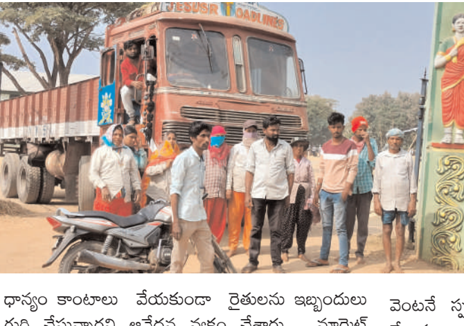
ధాన్యం కొంటాలు వేయకుండా రైతులను ఇబ్బందులు గురి చేస్తున్నారని ఆవేదన వ్యక్తం చేశారు. మార్కెట్ వెంటనే స్పందించి రైతులను ఆదుకోవాలని డిమాండ్ చేశారు.

• తేమ శాతం, సంచల కొరతతో ధాన్యం కొనుగోలు చేయకుండా రైతులను ఇబ్బందులకు గురి చేస్తున్నారని రైతులు ఆవేదన.. ఖమ్మం/ వైరా జనవరి 4 (అక్షరం/స్టూన్) ఖమ్మం జిల్లా వైరా వ్యవసాయ మార్కెట్ యార్డ్ లో ఏర్పాటు చేసిన ధాన్యం కొనుగోలు కేంద్రంలో తేమ శాతం సంచల కొరత పేరుతో ధాన్యం కొంటాలు వేయకుండా రైతులను ఇబ్బందులు గురి చేస్తున్నారని మార్కెట్ యార్డ్ ముందు రైతుల నిరసన చేపట్టారు. వైరా వ్యవసాయ మార్కెట్ యార్డ్లో డిసీఎంఎస్ ఆధ్వర్యంలో ధాన్యం కొనుగోలు కేంద్రాన్ని ఏర్పాటు చేశారు. రైతుల తెచ్చిన ధాన్యాన్ని తేమ శాతం సంచల కొరత పేరుతో