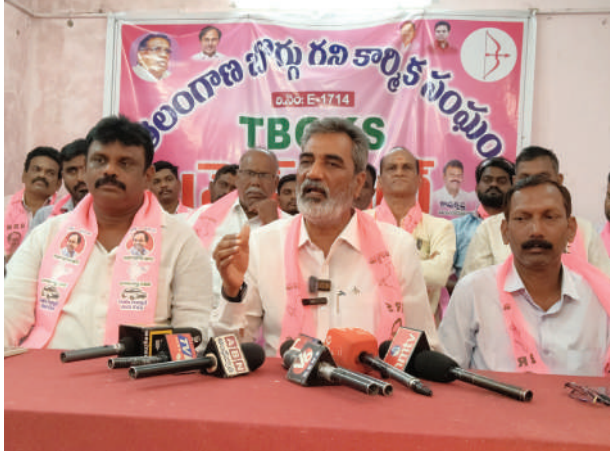
భద్రాద్రి కొత్తగూడెం/ కొత్తగూడెం/ జూన్ 19 / అక్షరం న్యూస్ :-