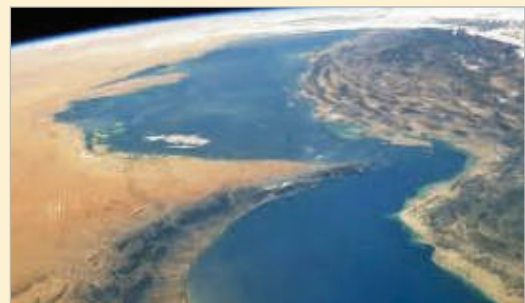
టోక్యో, జూన్ 6 పశ్చిమాసియాలో యుద్ధ మేఘాలు మళ్లీ మునుగుతున్నాయి. హోర్నూజ్ జలసంధి లక్ష్యంగా ఇరాన్ ప్రయోగించిన నాలుగు ద్రోణును అమెరికా సైన్యం కూల్చివేసింది. దీనికి