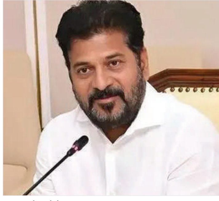
ఏర్పాటు చేయబోయే సౌర విద్యుత్తు ప్లాంట్ కు శంకుస్థాపన చేస్తారు. ఆసిఫాబాద్ మున్సిపాలిటీ పరిధిలో రూ.15 కోట్లతో

కొత్తగూడలో 25 ఇందిరమ్మ ఇళ్ల ప్రారంభం.. రెండో విడత ఇందిరమ్మ ఇళ్ల మంజూరు హైదరాబాద్/ఆసిఫాబాద్/శంషాబాద్ రూరల్, మే 31: ముఖ్యమంత్రి రేవంత్ రెడ్డి సోమవారం కుమరంభం ఆసిఫాబాద్ జిల్లాలో పర్యటించనున్నారు. జిల్లాలో పలు అభివృద్ధి పనులకు శంకుస్థాపనలు, ప్రారంభోత్సవాలు చేయనున్నారు. జిల్లాలో సుమారు రూ.112.14 కోట్ల అభివృద్ధి పనులకు శ్రీకారం చుట్టనున్నారు. కెరీమచిలమల కొర్రా పంచాయతీ పరిధిలోని కొత్తగూడలో ఇందిరమ్మ ఇళ్లను ప్రారంభించనున్నారు. కాగజీనగర్ ఎక్స్ ప్రెస్ సమీపంలో ఏర్పాటు చేసిన బహిరంగ సభలో పాల్గొంటారు. అదే వేదిక నుంచి రాష్ట్రంలో రెండో విడత కింద 2.50 లక్షల ఇందిరమ్మ ఇళ్లను మంజూరు చేయనున్నారు. చింతలమానేపల్లి మండలంలోని కొటాలలో రూ.56.55 కోట్లతో ఏర్పాటు చేయనున్న 132/33 కేపీ విద్యుత్తు సబ్ స్టేషన్ నిర్మాణ పనులకు, గుడ్లబోరి, కాపువాడ, చింతకుంట, అంకుషాపూర్ ప్రాంతాల్లో నిర్మించే 33/11 కేపీ సబ్ స్టేషన్ల పనులకు సీఎం శంకుస్థాపనలు చేయనున్నారు. వీటితో పాటు రెచ్చెన మండలం నాంబాల్లో రూ.6 కోట్లతో