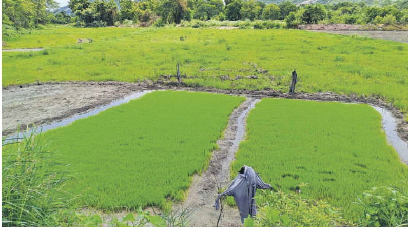
రాజన్న సిరిసిల్ల /ముస్తాబాద్ /జూన్ -18(అక్షరం న్యూస్ కలపరపెడుతోంది)