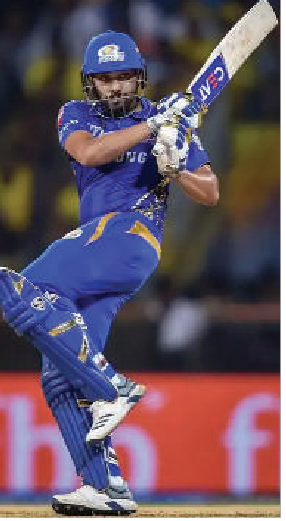
బలాన్ని ఇస్తుండగా, తదుపరి మ్యాచ్ లో ఆయన ధోనీ రికార్డును ఎప్పుడు దాటుతారోనని క్రికెట్ లోకం ఆసక్తిగా ఎదురుచూస్తోంది.