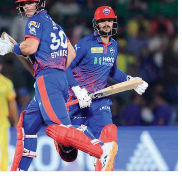
అడుకున్న రిజ్జీ స్ట్రైట్ ఢిల్లీ క్యాపిటల్స్ బ్యాటర్లు మరోసారి తడబడ్డారు.