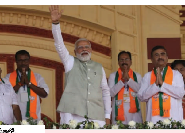
మగతా 2వ పేజీలో..