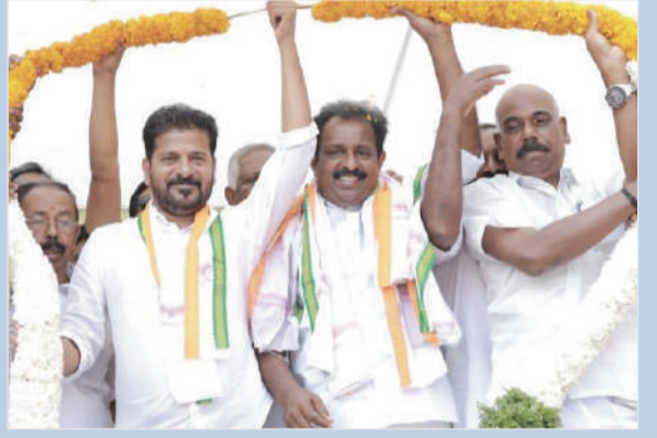
మగతా 2వ పేజీలో..