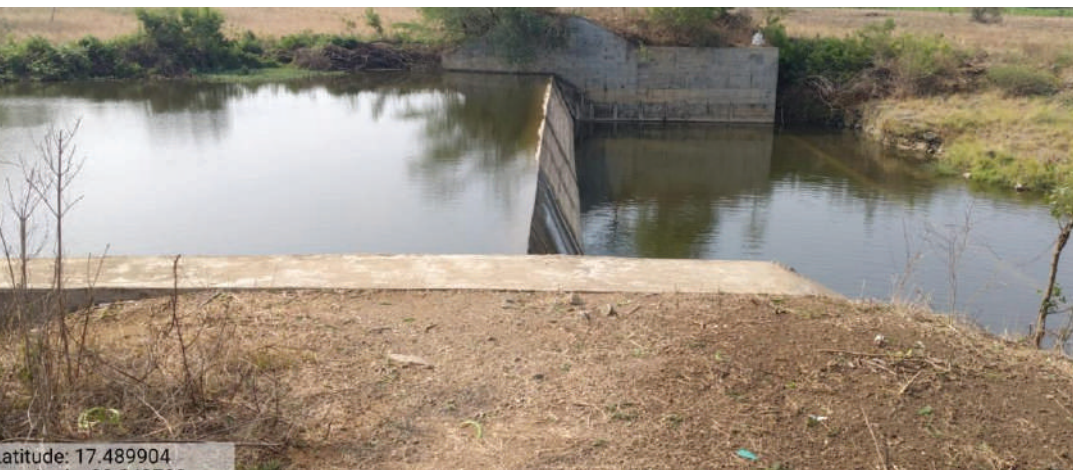
భూగర్భ పైపులైన్ (గ్రావిటీ మెయిన్) విధానాన్ని

పనుల ఖర్చు రూ.53.29 కోట్లు, పనులు రూ.21.23 కోట్లు, భూసేకరణకు రూ.10.71 కోట్లు, ఇతర వ్యయాలకు రూ.3.19 కోట్లు కేటాయించారు. ఈ ప్రాజెక్టు అమలుతో కామేపల్లి, రఘునాథపాలెం మండలాల్లోని 13 గ్రామాలకు చెందిన 31 చెరువులను వరద నీటితో నింపే అవకాశం లభిస్తుంది. దాదాపు 2,866 ఎకరాల ఆయకట్టు స్థిరీకరణ జరగనుండటంతో, రైతులకు నిత్య సాగునీటి భరోసా కలుగుతుంది. ఇది వ్యవసాయ ఉత్పాదకత పెంపుకు, రైతుల ఆదాయ వృద్ధికి దోహదం చేయనుంది. గతంలో భూసేకరణ సమస్యలు, రైతుల అభ్యంతరాల కారణంగా ఈ పనులు నిలిచిపోయిన నేపథ్యంలో, మంత్రి తుమ్మల ప్రత్యేక చొరవతో ప్రాజెక్టు రూపకల్పనలో కీలక మార్పులు చేశారు. ఓపేన్ కాలువ తవ్వకానికి బదులుగా