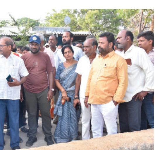
గురువీర, వివిధ విభాగాల అధికారులు, సిబ్బంది పాల్గొన్నారు.