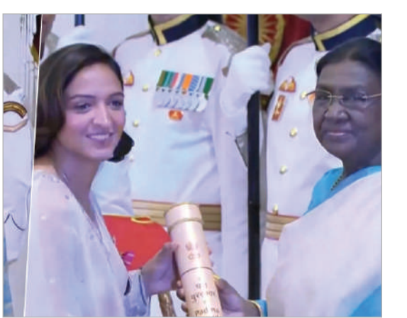
భారత మహిళల క్రికెట్ జట్టు కెప్టెన్ హర్షన్ ప్రీత్ కార్

రాష్ట్రపతి ద్రౌపది ముర్ము సోమవారం, మే 25, 2026న పద్మశ్రీ పురస్కారాన్ని ప్రధానం చేశారు. ఢిల్లీలోని రాష్ట్రపతి భవన్ లో, దేశ క్రికెట్ కు ఆమె చేసిన విశేష కృషికి ఈ ఉన్నత గౌరవం దక్కింది. ఆమె నాయకత్వంలోనే గత నవంబర్ లో భారత మహిళల జట్టు స్వదేశంలో ప్రపంచకప్ ను గెలిచి చారిత్రక విజయాన్ని అందుకుంది. ఈ విజయంలో ఆమె కీలక పాత్ర పోషించారు. ప్రతిష్టాత్మక అవార్డును స్వీకరించడానికి క్రిమీ రంగం సంప్రదాయ దుస్తులలో హాజరైన ఆమె అందరి దృష్టిని ఆకర్షించారు. రాష్ట్రపతి భవన్ లో జరిగిన మొదటి పౌర పురస్కారాల ప్రధానోత్సవంలో రాష్ట్రపతి రెండు పద్మ విభూషణలు, ఆరు పద్మ భూషణలు, 58 పద్మశ్రీ అవార్డులను అందించారు. 2026 సంవత్సరానికి