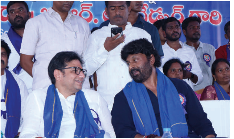
అంబేద్కర్ దని ద్వారా అంబేద్కర్ అవకాశం కల్పించారని అన్నారు. అంబేద్కర్ చూపిన రాజ్యాంగం ద్వారా కల్పించిన సదవకాశాలను మార్గంలో పయనిస్తూ సద్వినియోగం చేసుకొని మహిళలు , పేదలు వైకెడగాలని

ముఖ్య అతిథిగా హాజరయ్యారు. ఈ సందర్భంగా ఆయన మాట్లాడుతూ బి ఎ ఎస్ , బి పి ఎస్ , గ్రూప్ వన్ , టూ , ట్రీ , ఫోర్ లాంటి పోటీ పరీక్షల్లో విజయం సాధించడానికి స్థానిక నిరుపేద అభ్యర్థులు వ్యయ ప్రయాసల కోర్చి ఢిల్లీ, హైదరాబాద్ లాంటి సుదూర ప్రాంతాలకు వెళ్లాలి అవసరం లేకుండా స్థానికమైన సాంఘిక సంక్షేమ శాఖా మంత్రి అద్దూరి లక్ష్మణ్ కుమార్ సహకారంతో అంబేద్కర్ నాలెడ్జ్ సెంటర్ ఏర్పాటు చేసి అన్ని వసతులు కల్పించి త్వరలోనే అందుబాటులోకి తెస్తామని అన్నారు. స్థానిక ఎం ఎల్ ఎ విజ్ఞప్తి మేరకు నాలెడ్జ్ సెంటర్ తో పాటు అనువైన స్థలాన్ని గుర్తించి అంబేద్కర్ కమ్యూనిటీ హాల్ కూడా నిర్మిస్తామని ఇందుకు అవసరమైన నిధులు కూడా సమకూరుస్తామని అన్నారు. అందరికీ సమాన అవకాశాలు కల్పించాలనే బాబా అంబేద్కర్ ఆయనల సాధనే లక్ష్యంగా తమ ప్రభుత్వం పని చేస్తున్నదని అన్నారు. అన్ని వర్గాలకు న్యాయశీ జరగాలని , మహిళల గౌరవం , ఆత్మాభిమానశీ ఇనుమడించాలనే అంబేద్కర్ ఆలోచనా విధానానికి అనుగుణంగా తమ ప్రభుత్వ పథకాల రూపకల్పన జరుగుతున్నదని అన్నారు. రామగుండం నగరంలో దళిత వాడలలో అభివృద్ధి పనులు చేపట్టడానికి ఈ రెండేళ్ల కాలంలో 14 కోట్ల రూపాయలు , సంక్షేమ కార్యక్రమాల్లో భాగంగా బ్యాంక్ లింకేజీ కింద మరో 14 కోట్ల రూపాయలు వెచ్చించడం జరిగిందని వెల్లడించారు. ఇంకా ఎన్ని నిధులైనా వెచ్చించడానికి సిద్ధంగా ఉన్నామని అన్నారు. పాల్గొని కలితంగా అర్జులశరీరికీ ఇందిరమ్మ ఇండ్లు మంజూరు చేస్తామని అన్నారు. రామగుండం నగర ప్రజలు డైనమిక్ వైబ్రెంట్ అని అభివృద్ధి, సంక్షేమానికి సంబంధించి మంచి సూచనలు చేస్తే వాటిని ప్రభుత్వ