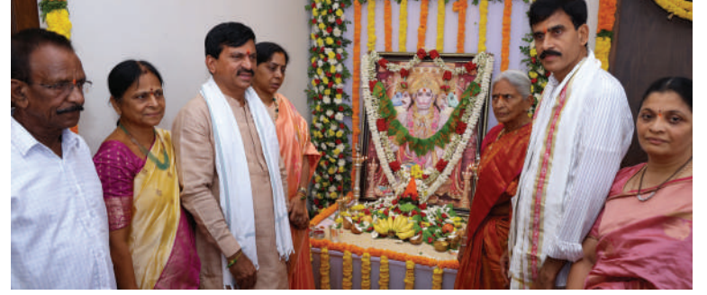
ఆధ్యాత్మిక వేదికను ప్రాంతమంతా భక్తి పారవశ్యంలో మునిగిపోయింది. తలపించింది.

ఖమ్మం స్టాఫ్ రిపోర్టర్ / కల్లూరు/ ఏప్రిల్ 14 / అక్షరం: సూర్య :- భక్తిశ్రద్ధలు ఆధ్యాత్మిక పరిమళాల మధ్య కల్లూరు మండలం నారాయణపురం గ్రామం పులకించిపోయింది. తెలంగాణ రెవెన్యూ, గృహ నిర్మాణం, సమాచార శాఖ మంత్రి పొంగులేటి శ్రీనివాస్ రెడ్డి స్వగృహంలో హనుమాన్ చాలీసా పారాయణ ఘట్టం అత్యంత వైభవంగా ఆధ్యాత్మిక చైతన్యాన్ని నింపుతూ సాగింది. మంగళవారం నాటి పవిత్ర ఘడియల్లో ఆంజనేయ స్వామి స్తోత్ర పారాయణంతో మంత్రి నివాసం