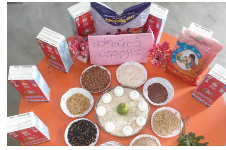
చొప్పుండి /కరింనగర్, ఏప్రిల్ 13 (అక్షరం న్యూస్ ) చొప్పుండి పట్టణం లోని గాంధీ నగర్ లో గల 5 వ అంగన్వాడీ కేంద్రం లో