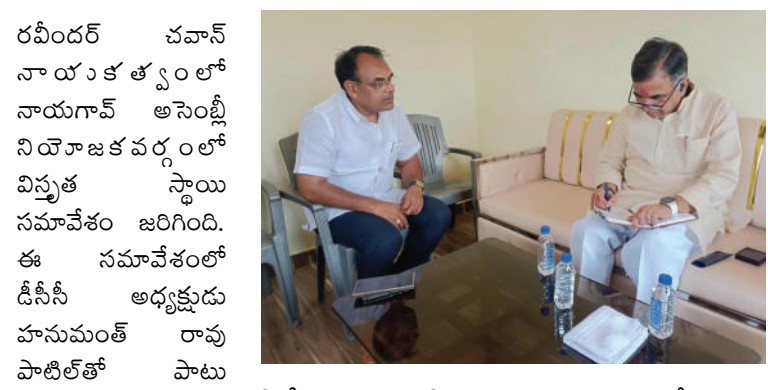
పార్టీని గ్రామ స్థాయి నుంచి బలపరచే దిశగా సానుకూలంగా సాగినట్లు నాయకులు అభిప్రాయపడ్డారు.