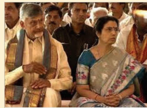
ఓంటిమిట్ట, మార్చి 31 ఓంటిమిట్టలోని ప్రసిద్ధ కోదండరామ స్వామి ఆలయంలో వార్షిక బ్రహ్మోత్సవాలు ఘనంగా జరుగుతున్నాయి. ఇందులో భాగంగా ఏప్రిల్ 1 బుధవారం రాత్రి ఓంటిమిట్ట సీతారాముల కల్యాణం అంగరంగ వైభవంగా జరగనుంది. ఈ మహోత్సవానికి ముఖ్యమంత్రి నారా చంద్రబాబు నాయుడు దంపతులు హాజరవుతారు. రాష్ట్ర ప్రభుత్వం తరఫున స్వామి వారికి పట్టుపూజలు, ముత్యాల తలంబ్రాలను సీంహ చంద్రబాబు సమర్పించనున్నారు. కల్యాణోత్సవం వైభవంగా నిర్వహించేందుకు ఆలయ అధికారులు అన్ని ఏర్పాట్లు పూర్తి చేశారు. బ్రహ్మోత్సవాల సందర్భంగా ఆలయ ప్రాంగణం, పురవీధులు రంగురంగుల దీపాలు, ప్రకాశవంతమైన ప్రదర్శన బోర్డులతో అలంకరించారు. భక్తుల సౌకర్యార్థం తగిన ఏర్పాట్లు చేయడంతో పాటు, పటిష్టమైన బందోబస్తును ఏర్పాటు చేశారు. మార్చి 26న అంకారాగృహతో ప్రారంభమైన ఈ ఉత్సవాలు ఏప్రిల్ 5 వరకు వైభవంగా జరగనున్నాయి. బ్రహ్మోత్సవాలకు భక్తులు పెద్ద సంఖ్యలో తరలివచ్చి స్వామి వారిని దర్శనం చేసుకుంటున్నారు. మంగళవారం ఉదయం మోహినీ అలంకారంలో కోదండరాముడు భక్తులకు దర్శనమిస్తున్నాడు. ఇవాళ రాత్రి గురు వాహనంపై ఓంటిమిట్ట పురవీధుల్లో స్వామి వారి ఊరేగింపు నిర్వహించనున్నారు.

నేటి కళ్యాణోత్సవానికి సింహ చంద్రబాబు దంపతుల రాక