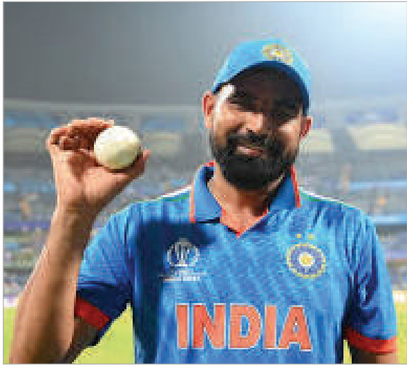
ప్రస్తుతానికి రిటైర్మెంట్ గురించి ఆలోచించడం లేదని స్పష్టం చేశాడు. రిటైర్మెంట్ ఆలోచన మనల్ని మరింత వెనక్కి

సీనియర్ ఫాస్ట్ బౌలర్ మహ్మద్ షమీకి టీమిండియాలోకి దారులన్నీ దాదాపు కోణ్ అయిన విషయం తెలిసిందే. వయసు ప్రభావం, ఫిట్నెస్ సమస్యలను కారణంగా చూపుతూ.. సెలెక్షన్ కమిటీ షమీ పేరును పరిగణలోకి తీసుకోవట్లేదు. దీంతో దేశవ్యాప్తంలో సత్తా చాటుతున్నా.. షమీకి మాత్రం పిలుపురావడం లేదు. గతంలో టెస్టులు, వన్డేలు, టీ20 ఇలా మూడు ఫార్మాట్లలోనూ అదరగొట్టిన షమీని మళ్లీ టీమ్లోకి తీసుకోవాలని.. అతని అనుభవం ఎంతో ఉపయోగపడుతుందని మాజీలు కూడా నూచించారు. షమీ తన చివరి వన్డే.. 2025 మార్చి 9న ఐసీసీ ఛాంపియన్స్ ట్రోఫీ ఫైనల్లో ఆడాడు. చివరి టీ20 అంతర్జాతీయ మ్యాచ్ను 2025 ఫిబ్రవరి 2న ముంబైలో ఇంగ్లాండ్పై ఆడాడు. ఇక టెస్టు క్రికెట్ ఆడి మూడేళ్లకుపైనే అయింది. ఈ నేపథ్యంలోనే షమీ రిటైర్మెంట్ విషయంపై క్షాంతి ఇచ్చేశాడు.'ది కుబ్జకర్ మిత్రా షో' మహ్మద్ షమీ మాట్లాడుతూ.. తాను అలసిపోయినప్పుడు క్రికెట్ వీడ్కోలు పలుకుతానని..