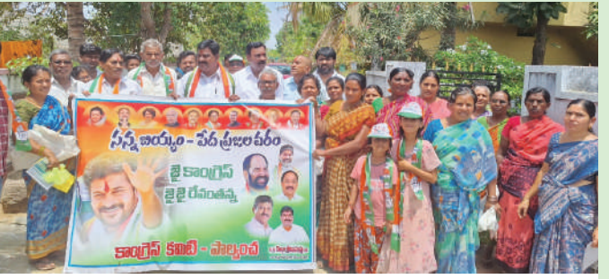
ఖమ్మం/స్టాఫ్ రిపోర్టర్ ఏప్రిల్ /తల్లాడ (అక్షరంన్యూస్)