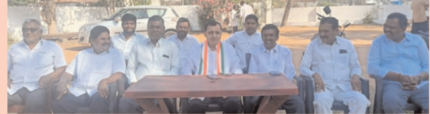
రాజన్న సిరిసిల్ల /ముస్తాబాద్ /ఫిబ్రవరి -17(అక్షరం స్యూస్ )