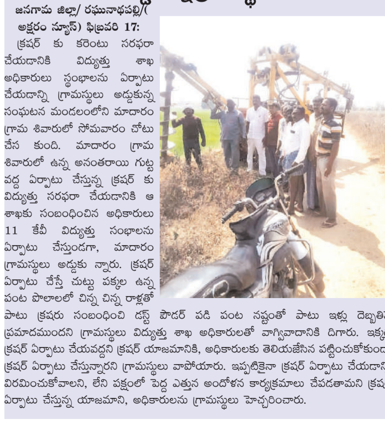
జనగామ జిల్లా/ రఘునాథపల్లి( అక్షరం స్టూన్స్ ) ఫిబ్రవరి 17: క్రషర్ కు కరెంటు సరఫరా చేయడానికి విద్యుత్తు శాఖ అధికారులు స్థంభాలను ఏర్పాటు చేయడాన్ని గ్రామస్థులు అడ్డుకున్న సంఘటన మండలంలోని మాదారం గ్రామ శివారులో సోమవారం చోటు చేస కుంది. మాదారం గ్రామ శివారులో ఉన్న అనంతరాలు గట్ల పద్ద ఏర్పాటు చేస్తున్న క్రషర్ కు విద్యుత్తు సరఫరా చేయడానికి ఆ శాఖకు సంబంధించిన అధికారులు 11 కేవీ విద్యుత్తు స్థంభాలను ఏర్పాటు చేస్తుండగా, మాదారం గ్రామస్థులు అడ్డుకున్నారు. క్రషర్ ఏర్పాటు చేస్తే చుట్టూ పక్కల ఉన్న పంట పొలాలలో చిన్న చిన్న రాళ్లతో పాటు క్రషరు సంబంధించి డస్ట్ పౌడర్ పడి వంట నష్టంతో పాటు ఇళ్లు దెబ్బతినే ప్రమాదముందని గ్రామస్థులు విద్యుత్తు శాఖ అధికారులతో వాగ్వివాదానికి దిగారు. ఇక్కడ క్రషర్ ఏర్పాటు చేయవద్దని క్రషర్ యాజమానికి, అధికారులకు తెలియజేసిన పట్టింతుకోకుండా క్రషర్ ఏర్పాటు చేస్తున్నారని గ్రామస్థులు వాపోయారు. ఇప్పటికైనా క్రషర్ ఏర్పాటు చేయడాన్ని విరమించుకోవాలని, లేని పక్షంలో పెద్ద ఎత్తున అందోళన కార్యక్రమాల చేపడతామని క్రషర్ ఏర్పాటు చేస్తున్న యాజమాని, అధికారులను గ్రామస్థులు హెచ్చరించారు.