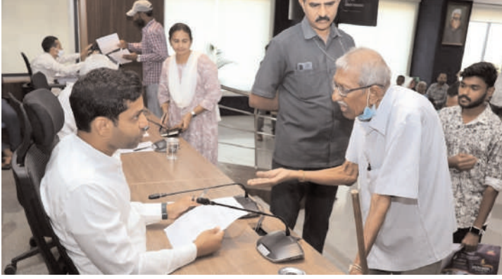
ఖమ్మం/ స్టాఫ్ రిపోర్టర్ ఫిబ్రవరి 17 (అక్షరంస్వర్ణం)