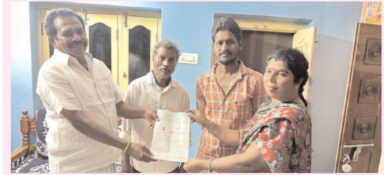
ఖమ్మం/స్టాఫ్ రిపోర్టర్ ఫిబ్రవరి/ తల్లాడ 17 (అక్షరంస్వర్ణం)