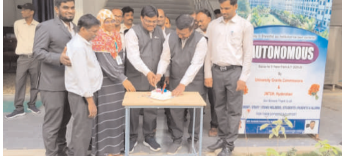
పెద్దపల్లి టౌన్ ఫిబ్రవరి 17 అక్షరం స్యూస్