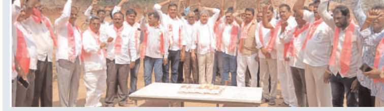
ఖమ్మం/స్టాఫ్ రిపోర్టర్ వినూర్ /ఫిబ్రవరి 17 (అక్షరం న్యూస్)