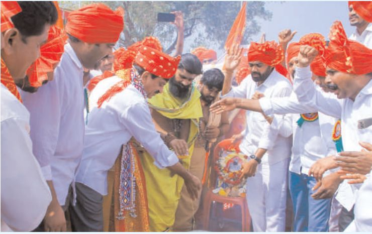
ఖమ్మం/ స్టాఫ్ రిపోర్టర్ ఫిబ్రవరి 17 (అక్షరం న్యూస్)

లంబాడీ అంటేనే కాంగ్రెస్ పార్టీ, కాంగ్రెస్ పార్టీ అంటేనే లంబాడీ అని తెలంగాణ రాష్ట్ర రెవెన్యూ గృహ నిర్మాణ సహాయక శాఖల మంత్రి పాంగులేటి శ్రీనివాస్ రెడ్డి అన్నారు. సోమవారం కూసుమంచి మండల కేంద్రంలోని బంజారా భవన్ స్థలంలో నిర్వహించిన సంత్ సేవాలాల్ మహారాజ్ 286వ జయంతి ఉత్సవాల్లో పాల్గొని ప్రసంగించారు. సంత్ సేవాలాల్ జయంతిని ఫిబ్రవరి 15న రాష్ట్ర ప్రభుత్వం అధికారికంగా సెలవు దినంగా ప్రకటించింది అన్నారు. బంజారాలను వర్షిలో చేర్చిన ఘనత ఇందిరమ్మ ప్రభుత్వంలో కాంగ్రెస్ దేనని, లంబాడీలు గత అసెంబ్లీ ఎన్నికల్లో తనకు భారీ మెజారిటీ రావడంలో కీలక పాత్ర పోషించారని అన్నారు. సేవాలాల్ ను బంజారాల ఆరాధ్య దైవంగా పిలుస్తారు. అతన్ని హిందూధర్మం గోపుతనం బంజారాలకు తెలియజేయడానికి జన్మించిన మహాసభాపూనిగా భావిస్తారని, హిందూ పాపమని, మత్తు, ధూమపానం శాపం అని పాతవు పలికి బంజారా జాతికి కాదు యావత్తు ఇతర కులాలకుఅధర్మంగా ఎన్నో సేవకార్యక్రమాలు చేయడంలో దేవుడయ్యాడని తెలిపారు. సేవాలాల్ అనాడు బంజారా జాతి పరువు ప్రతిష్టల గురించి ముందుగానే ఊహించి అహింస సిద్ధాంతానికి పునాది వేసి ఆచరించి చూపారని, బ్రిటిష్ పాలకుల మత ప్రచారం ద్వారా బంజారా సమాజం అనేక ఇబ్బందులకు గురి అయ్యింది. ఈ పరిస్థితులలో బంజారా జాతిని సన్మార్గంలో నడిపించేందుకు సేవాలాల్ మహారాజ్ అవతరించి అదివాసీ హక్కుల పరిరక్షణ, సమాజ మార్గదర్శకత్వంలో కీలక పాత్ర పోషించారని, ఆయన చూపిన మార్గం అదివాసీ ఉధృతాలకు, సామాజిక సమానత్వ పోరాటాలకు ప్రేరణని నిలుస్తోందని, గోండు తెగకు చెందిన మహాసభాపూనిగా, సమాజ సేవకుడిగా, అదివాసీ హక్కుల పరిరక్షకుడిగా గుర్తింపు పొందారు. గోండు తెగ ప్రజలను ఆర్థికంగా, సాంస్కృతికంగా, రాజకీయంగా అభివృద్ధి చేసేందుకు