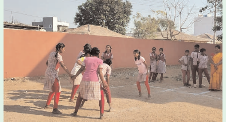
రాజన్న సిరిసిల్ల /ముస్తాబాద్ /ఫిబ్రవరి -17(అక్షరం న్యూస్ )