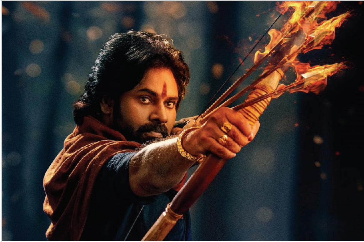
ప్రొడక్షన్ వర్క్ మొత్తం జరుగుతోందని తెలుస్తోంది. ఈ సునీల్, రఘుబాబు, సుబ్బారాజు, నోరా ఫతేహీ తదితరులు సినిమాలో ఇతర ప్రధాన పాత్రలను బాబీ దియోల్, నాజర్, పోషించారు.