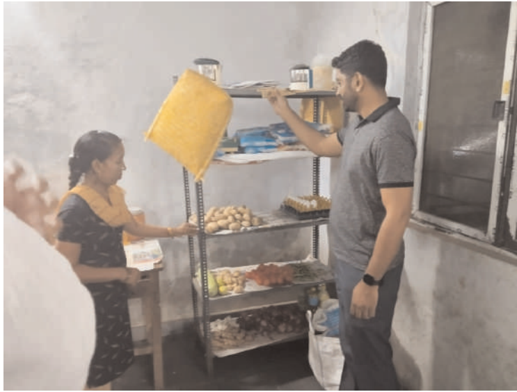
భద్రాద్రి కొత్తగూడెం ఫిబ్రవరి 21 (అక్షరం న్యూస్)