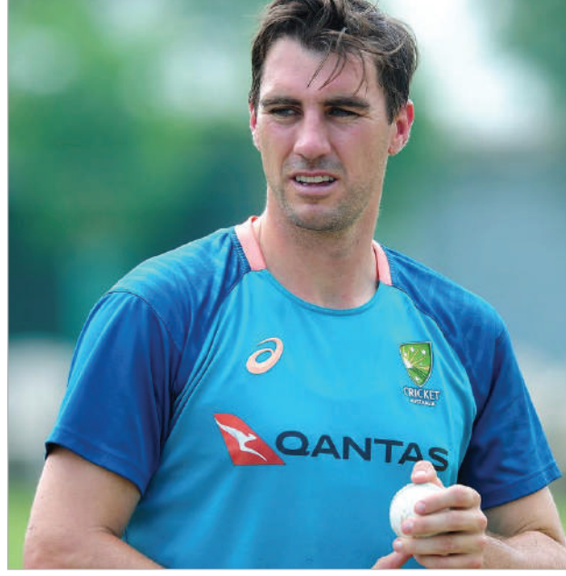
మాట్లాడుతూ, 'ఇది నాకు ఓ అద్భుతమైన నెల. టైరింగ్ లేదా

ఆస్ట్రేలియా కెప్టెన్ పాట్ కమిన్స్ ఆశాభావం గాయం నుంచి త్వరగా కోలుకొని 2025 ఇండియన్ ప్రీమియర్ లీగ్ (ఐపీఎల్?) కల్లా అందుబాటులోకి రావాలని ఉందంటూ ఆస్ట్రేలియా కెప్టెన్ పాట్ కమిన్స్ ఆశాభావం వ్యక్తం చేశాడు. చీలమండ గాయం కారణంగా 2025 ఐసీసీ ఛాంపియన్స్ ట్రోఫీకి దూరమైన కమిన్స్ ప్రస్తుతం నెమ్మదిగా కోలుకుంటున్నాడు. దీంతో తన టైమ్?ను ఇప్పుడు ఈ సమయాన్ని రికవరీ కోసం అలాగే ఫ్యామిలీతో గడిపేందుకు ఉపయోగించుకున్నట్లు పేర్కొన్నాడు. ఈ క్రేజ్ ని రాబోతున్న కీలక టోర్నీలు ప్రపంచ టెస్ట్ ఛాంపియన్ షిప్ ఫైనల్, ఐపీఎల్ కి ముందు పూర్తిగా కోలుకునేందుకు లభించిన అవకాశంగా భావిస్తున్నాడు. ఛాంపియన్స్ ట్రోఫీకి ముందు ఆస్ట్రేలియాకు గట్టి ఎదురుదెబ్బలు తగిలాయి. కమిన్స్ సహా ఫాస్ట్ బొల్లర్ హేజిల్ వుడ్, ఆల్-రౌండ్ల మార్కస్ స్టాయిసన్, మిచెల్ మార్ష్ వంటి కీలక ఆటగాళ్లను కోల్పోయింది. కమిన్స్ స్థానంలో వైస్ కెప్టెన్ స్టీవ్ స్మిత్ కెప్టెన్ గా వ్యవహరించనున్నాడు. ఇటీవల పాట్ కమిన్స్ ఓ ఇంటర్వ్యూలో