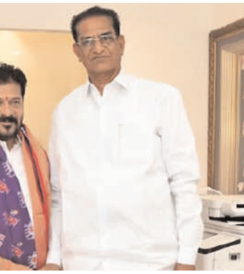
ఖమ్మం/స్టాఫ్ రిపోర్టర్ ఫిబ్రవరి 18 (అక్షరం/స్టాఫ్) జిల్లా కేంద్ర సహకార బ్యాంకులు మరియు సహకార సంఘాల పదవీ కాలాన్ని ఆరు నెలలు పాటు పొడిగించి నందుకు కృతజ్ఞతగా ముఖ్యమంత్రి రేవంత్ రెడ్డిని