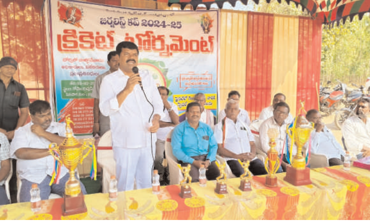
భద్రాద్రి కొత్తగూడెం, పినపాక, ఫిబ్రవరి 03 (అక్షరంన్యూస్): పినపాక ప్రెస్ క్లబ్ ఆధ్వర్యంలో గోపాలరావు పేట గ్రామంలోని క్రీడా మైదానంలో నిర్వహిస్తున్న జర్నలిస్టు కవ్ క్రికెట్ టోర్నమెంట్ ని సోమవారం పినపాక ఎమ్మెల్యే పాయం వెంకటేశ్వర్లు ముఖ్య