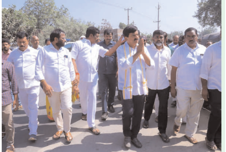
ఖమ్మం/ స్టాఫ్ రిపోర్టర్ ఫిబ్రవరి 3 (అక్షరంన్యూస్) ఖమ్మం రూరల్ : సర్ నమస్టే సర్... ఖాంకూర్ సర్ మా ఊరు వచ్చినందుకు... అంటూ ఒక్కొక్కరూ ఒక్కో పూలబోకెతో ఖమ్మం రూరల్ మండలం ఆరెంపుల గ్రామ పర్వటనకు వచ్చిన తెలంగాణ రెవెన్యూ, గృహ నిర్మాణం, సమాచార శాఖల మంత్రి పొంగలేటి శ్రీనివాసరెడ్డి ఘన స్వాగతం పలికారు. మీ రాక మాకెంతో సంతోషం అంటూ ఆనందం వ్యక్తం చేశారు. అది చూసిన మంత్రి పొంగలేటి మీ ఆదర అభిమానాలు ఎల్లప్పుడూ ఇలాగే ఉండాలని ఆకాంక్షించారు. అనంతరం గ్రామంలో మంజూరైన ఇందిరమ్మ ఇండ్లు లభిచారులను కలిసి వారికి అభినందనలు తెలిపారు. ఇంటి నిర్మాణం కోసం ముగ్గు పోసిన పలువురు లభిచారుల స్థలాలను పరిశీలించారు.