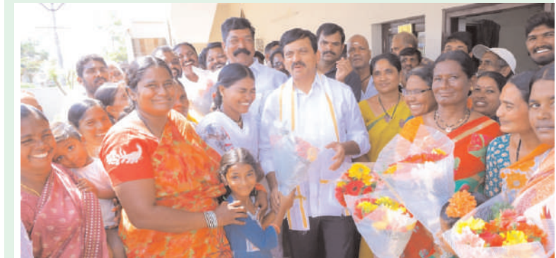
ఖమ్మం రూరల్ : సర్ నమస్టే సర్... ఖాంకూర్ సర్ మా ఊరు వచ్చినందుకు... అంటూ ఒక్కొక్కరూ ఒక్కో పూలబోకెతో ఖమ్మం రూరల్ మండలం ఆరెంపుల గ్రామ పర్వటనకు వచ్చిన తెలంగాణ రెవెన్యూ, గృహ నిర్మాణం, సమాచార శాఖల మంత్రి పొంగలేటి శ్రీనివాసరెడ్డి ఘన స్వాగతం పలికారు. మీ రాక మాకెంతో సంతోషం అంటూ ఆనందం వ్యక్తం చేశారు. అది చూసిన మంత్రి పొంగలేటి మీ ఆదర అభిమానాలు ఎల్లప్పుడూ ఇలాగే ఉండాలని ఆకాంక్షించారు. అనంతరం గ్రామంలో మంజూరైన ఇందిరమ్మ ఇండ్లు లభిచారులను కలిసి వారికి అభినందనలు తెలిపారు. ఇంటి నిర్మాణం కోసం ముగ్గు పోసిన పలువురు లభిచారుల స్థలాలను పరిశీలించారు.

మంత్రి పొంగలేటికి ఆరెంపుల గ్రామస్తులు పూల బోకెలతో ఘన స్వాగతం .