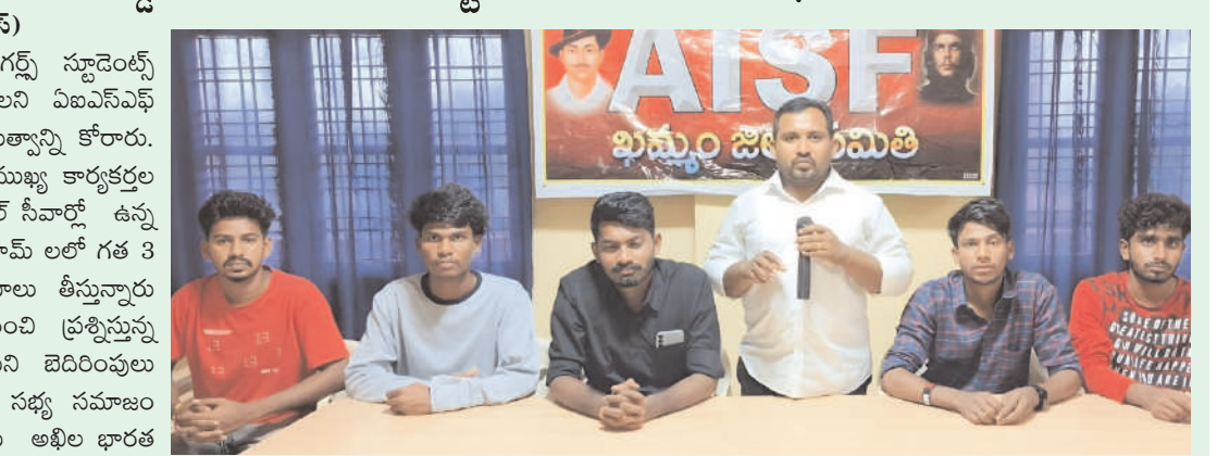
ఖమ్మం/ తల్లాడ జనపరి 2 (అక్షరంస్టూన్)