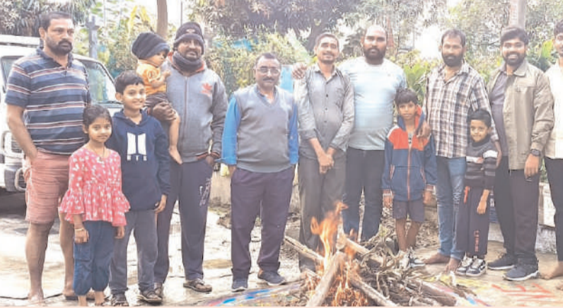
రామగిరి (పెద్దపల్లి జిల్లా) జనవరి 13 అక్షరం స్పూస్: