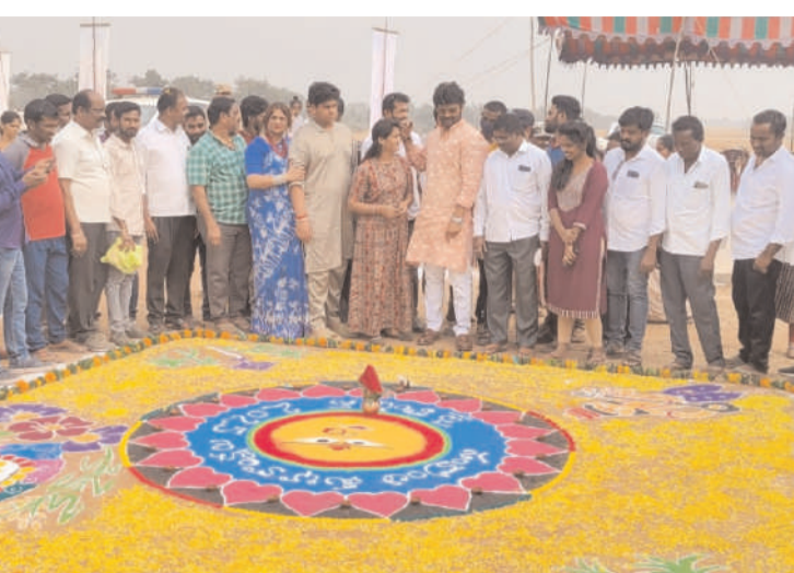
జ్యోతి నగర్ ఎస్ పి సి జనవరి 13 పెద్దపల్లి జిల్లా అక్షరం స్పూస్