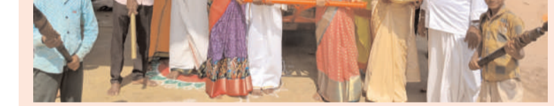
గద్వాల జిల్లా/అయిజ మండలం/జనవరి13/అక్షరం స్పూస్:-