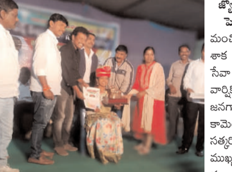
జ్యోతి నగర్ ఎస్పీసీ జనవరి 13 పెద్దపల్లి జిల్లా అక్షరం స్పూస్