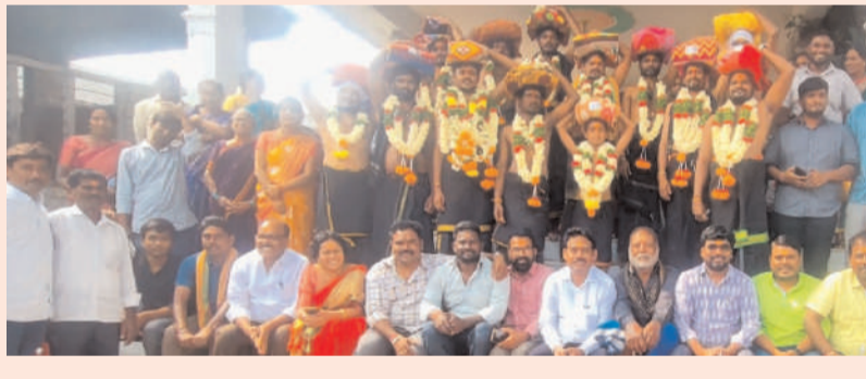
రామగిరి (పెద్దపల్లి జిల్లా) జనవరి 13 అక్షరం స్పూస్: