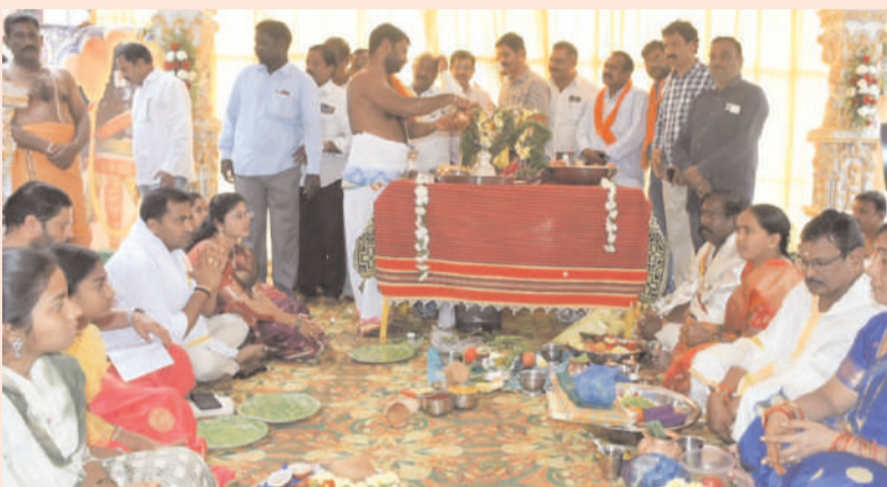
జ్యోతి నగర్ ఎస్పీసీ జనవరి 13 పెద్దపల్లి జిల్లా అక్షరం స్పూస్