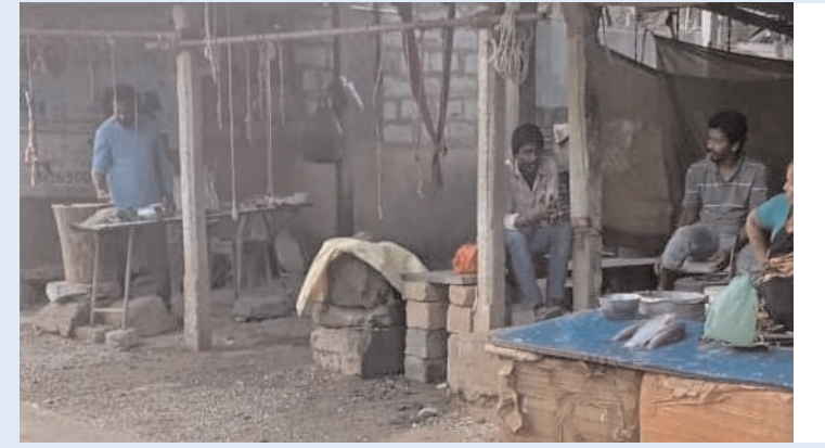
భద్రాద్రి కొత్తగూడెం జిల్లా/ దమ్మపేట మండలం / జనవరి 15/ అక్షరం న్యూస్:-

అత్యంత ప్రతిష్టాత్మకమైన సంక్రాంతి పండుగ మూడో రోజు కనుమ పండుగకు ఓ ప్రత్యేకత ఉంది. భోగి, మకర సంక్రాంతి, ఎంతో సంప్రదాయంగా జరుపుకునే ప్రజలు ఆఖరి రోజు అయిన కనుమనాడు ఎంతటి నిరుపేదయిన ముక్కు కొరకాల్సిందే అంతటి పేరుగాంచిన కనుమ రోజు మండలంలో వెలవెలబోతో పరిస్థితి నెలకొంది. ఆంధ్రప్రదేశ్ రాష్ట్రానికి కూత వేటలో ఉన్న దమ్మపేట మండల కేంద్రం ఆంధ్రకు తరలిపోయింది. తెలంగాణ రాష్ట్రంలో ఎటువంటి సంక్రాంతి సందబాలు లేకపోవడం వల్ల కోడండాల ప్రియులు, చిన్నా, పెద్ద ముఖ్యంగా యువత ఆంధ్రాలోని సంక్రాంతి సందబాలు వీక్షించడానికి వెళ్లిపోవడంతో అనునిత్యం రద్దీగా ఉండే పట్టణ కేంద్రంలోని రహదారులు ఖాళీ అయ్యాయి. కనుమ రోజునే సమ్మక్కన్న మాంసం వ్యాపారస్తులు, చాపల అంగడి వ్యాపారాలు లేక వదిలిబెట్టారు.