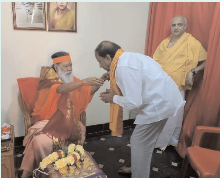
భద్రాద్రి కొత్తగూడెం జిల్లా/ దమ్మపేట మండలం/ జనవరి 15 / అక్షరం న్యూస్ :-