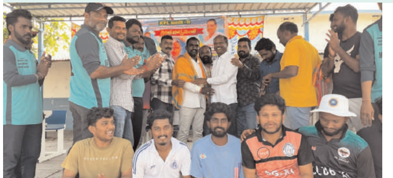
శంకరపట్నం/కరీంనగర్ / జనవరి 15/అక్షరం న్యూస్..