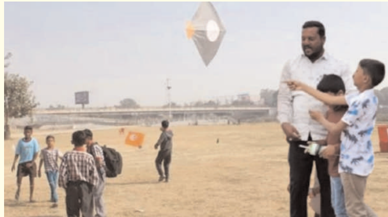
సంగారెడ్డి/ జహీరాబాద్/ రురాసంగం / జనవరి 15 /అక్షరం న్యూస్

రురాసంగం మండల కేంద్రంలో గల గ్రామంలో సంక్రాంతి వస్తోందంటే వాకిలి రంగవల్లులు, తెల్లవారు జామున హరిదాసులు, తెల్లవారిని తర్వాత గొబ్బియల్లో పాటలు, మధ్యాహ్నానికి పతంగులు గాల్లో ఎగరుతాయి. ఇవన్నీ పండుగ రాకను సూచించే ఉల్లాసాలు. సంక్రాంతి పండుగకు ఇంతే ఉల్లాసంగా ఉత్సాహం ఉత్సాహంగా పిల్లలందరూ కలిసిమెలిసి జరుపుకున్నారు. సంక్రాంతి పండుగకు మనదేశంలో, జహీరాబాద్ రురాసంగం లో జరిగే పతంగుల ఉత్సాహం అంటే పర్యాటకులు ఉరకలు వేస్తూ వస్తారు. రురాసంగం మండల కేంద్రంలో వేదికగా జరిగే ఈ వేడుకలకు జనవరి నుంచే ఏర్పాట్లు మొదలుపెట్టాయి. జనవరి నాటికే పూర్తి స్థాయిలో ముస్తాబయి గ్రామంలో అందరూ కలిసిమెలిసి పతంగులు ఎగిర వేస్తారు.