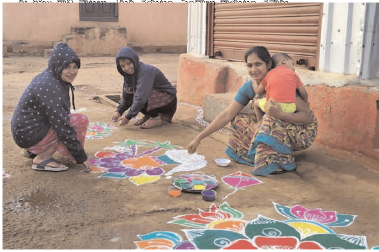
ఆడవారు ముగ్గులు వేయటం, ముగ్గుల పోటీలు జరుపుకోవటం చేస్తారు. ఈ పండుగరోజు ధాన్యం, వస్త్రాలు, సువ్వులు, దుంపలు, చెరుకు దానం చేస్తారు. స్త్రీలు పసుపు, కుంకుమ, సువ్వుల వంటలు, వస్త్రాలు, వెన్న ఇతరులకు ఇవ్వటం ద్వారా సకల సంపదలు పొందుతారని వారి నమ్మకం.

అయ్యప్ప దీక్ష చేసేవారు 40 రోజుల తరువాత అయ్యప్పను, మకర జ్యోతిని కూడా ఈ రోజే దర్శించుకుంటారు.