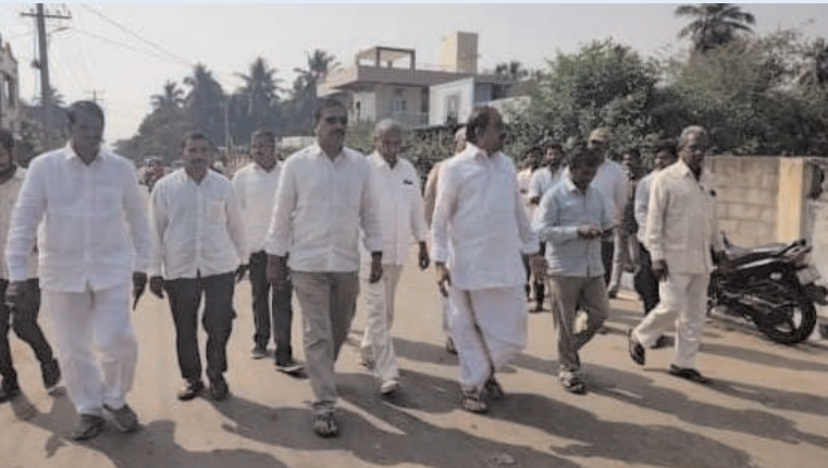
భద్రాద్రి కొత్తగూడెం జిల్లా/ దమ్మపేట మండలం/ జనవరి 15/ అక్షరం న్యూస్ :-