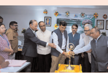
అతిపెద్ద విద్యుత్ కేంద్రంగా ఎదుగుతున్న రామగుండం ఎన్ఐపిసి