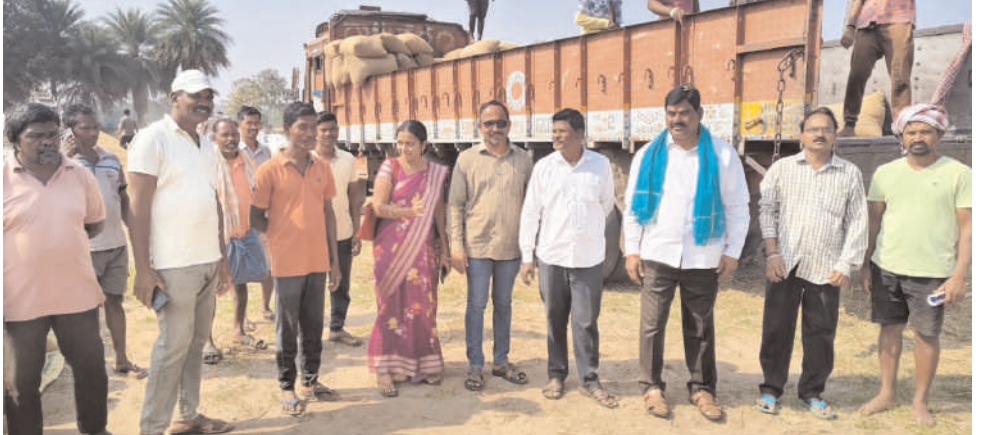
భద్రాద్రి కొత్తగూడెం, పాల్వంచ, జనవరి 11 (అక్షరం స్పాస్)

పగిడేరు ధాన్యం కొనుగోలు కేంద్రం సందర్శించిన కొత్తాల్.. రాష్ట్ర మార్కెట్ ఫెడ్ డైరెక్టర్ కొత్తాల్