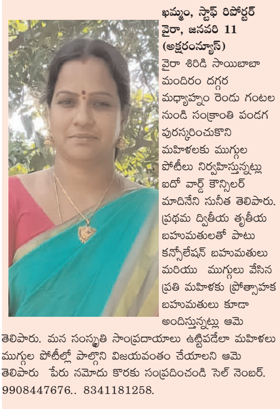
ఖమ్మం, స్టాఫ్ రిపోర్టర్