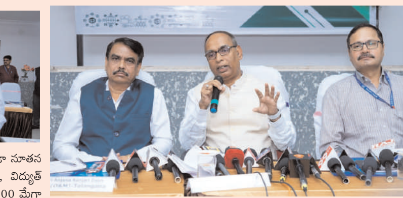
అతిపెద్ద విద్యుత్ కేంద్రంగా ఎదుగుతున్న రామగుండం ఎన్ఐపిసి