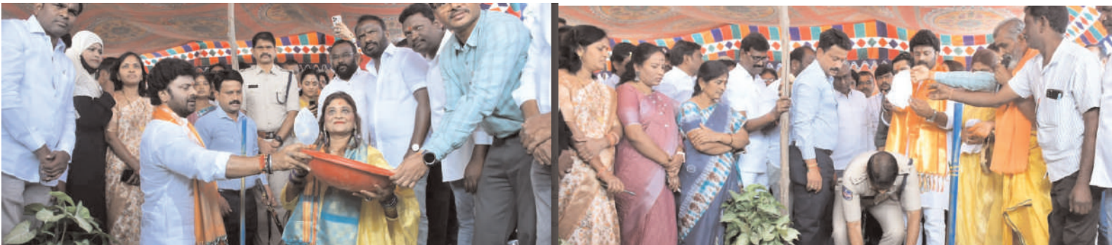
జ్యోతి నగర్ ఎన్సిపి జనవరి 11 పెద్దపల్లి జిల్లా