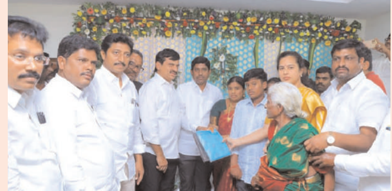
ఖమ్మం, స్టాఫ్ రిపోర్టర్ వైరా, జనవరి 11 (అక్షరం స్పాస్)