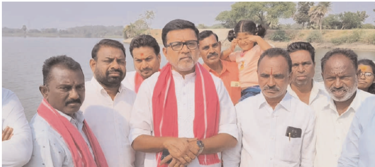
నీళ్లు ఇస్తారో...ఎక్కడి వరకు నీళ్లు ఇస్తారో మత్స్య సంపదను ఎలా కాపాడుతారో చెప్పాలని ఆయన డిమాండ్ చేశారు. నియోజకవర్గంలోని ప్రతి రైతు రెండు పంటలు సాగు చేసుకునే విధంగా సాగునీరు అందించాలని అన్నారు. రైతులకు ఏదో మేలు చేశామని గొప్పలు చెప్పుకోకుండా సాగునీరు అందించేలా చర్యలు చేపట్టాలన్నారు. ఈసారి వానాకాలంలో నైతం పంట దిగుబడి తగ్గిందని, ప్రభుత్వం ఇచ్చే బోనస్ ఫలితం కూడా లేదని, బోనస్ కోసం రైతులు ఇంకా ఎదురుచూస్తున్నారని ఆయన తెలిపారు. యాసంగి సీజన్లో సాగునీటి విషయంపై వెంటనే సుబ్బత ఇచ్చి రైతులను ఆదుకోవాలని ఆయన కోరారు.

ద్వారానైనా ప్రకటన చేయించలేదన్నారు. రెండురోజుల క్రితం ఎస్సారెస్సీఈఈ సాగునీటి విషయంపై మీటింగ్ పెట్టినట్లు పత్రికల్లో చూశానని, కానీ ఎలాంటి స్పందన లేదన్నారు. ఈ విషయంపై ఈతని కలిస్తే రెవేలీ వరకు నీళ్లు వచ్చాయని, రేపు సాయంత్రం వరకు నీళ్లు వస్తాయని చెప్పినట్లు ఆయన తెలిపారు. కానీ కేవలం 400నీళ్లు వస్తే అవి ఇక్కడి వరకు అందవని ఆయన అన్నారు. పడేళ్ల కాలంలో తమ ప్రభుత్వం శ్రీరాంసాగర్, ఎస్సారెస్సీల ద్వారా గుండారం రిజర్వాయర్లోకి నీటిని అందించి రెండు పంటలు సాగు చేసుకునే విధంగా నీళ్లు అందించామని తెలిపారు. ఈనాడు మంత్రి మాత్రం సాగునీటి విషయంలో మాట్లాడటం లేదని, మా మాటలు పట్టించుకోవడం లేదన్నారు. ఈ నియోజకవర్గంలో 80శాతం వ్యవసాయంపై ఆధారపడి జీవించే ఎస్సీ ఎస్టీ బీసీల ఆకలి తీర్చాలనే ఆలోచనతోనే ప్రజాజీవితంలోకి వచ్చామని, ఆనాడు అధికారంలో ఉన్నప్పుడు పనులు చేసి దగ్గరయ్యమని, ఈనాడు ప్రతిపక్షంలో ఉండి ప్రజా సమస్యలను ప్రభుత్వ దృష్టికి తీసుకెళ్లుతున్నామని అన్నారు. మంత్రిగా ముఖ్యమంత్రితో పొగిడించుకుంటున్న మంత్రి ఇక్కడి రైతుల గురించి ఎందుకు ఆలోచన చేయడం లేదని ఆయన ప్రశ్నించారు. ఈ ప్రాంత ప్రజలు, రైతులు ఓట్లు వేసి గెలిపిస్తేనే కదా ఈనాడు ముఖ్యమంత్రి పక్కన కూర్చుండి పొగిడించుకుంటున్నారనే విషయాన్ని గుర్తించాలన్నారు. ఇప్పటికైన మంత్రి స్పందించి ఎంత ఆయకట్టుకు