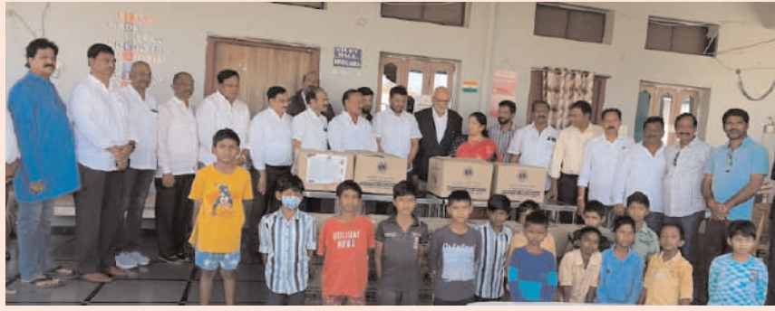
మహాబాబాబాద్ బ్యూరో అక్షరం సూన్స్ డిసెంబర్ 29.

-అండగా ఉండాలి సినీబిబ్ల్యుసి ఎదుటనే మోకాళ్లపై నిరీక్షణ.