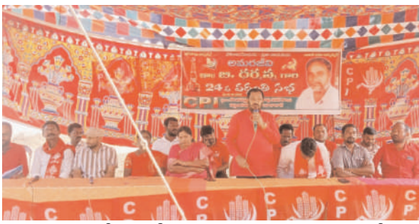
-ప్రజా సంక్షేమ కోసం నిరంతర పోరాటం చేసిన మహానేత...సిపిఐ జిల్లా కార్యదర్శి