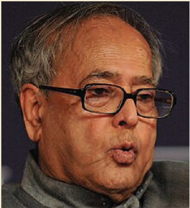
న్యూఢిల్లీ, డిసెంబర్ 28 (అక్షరంన్యూస్)

మాజీ ప్రధాని మన్మోహన్ సింగ్ అంత్యక్రియల సమయంలో కాంగ్రెస్ పార్టీలో వివాదం చెలరేగింది. తన తండ్రి, మాజీ రాష్ట్రపతి ప్రణబ్ ముఖర్జీని కాంగ్రెస్ పార్టీ సరిగ్గా గౌరవించలేదని, ఆయన విషయంలో తీరని అన్యాయం చేశారని శర్మిష్టా ముఖర్జీ కీలక వ్యాఖ్యలు చేశారు. ఈ మేరకు ఎక్స్ ప్రెస్ లో పోస్ట్ చేశారు. నిజానికి పివిని అధికారంలో ఉండి కాంగ్రెస్ నిరాదరించింది.