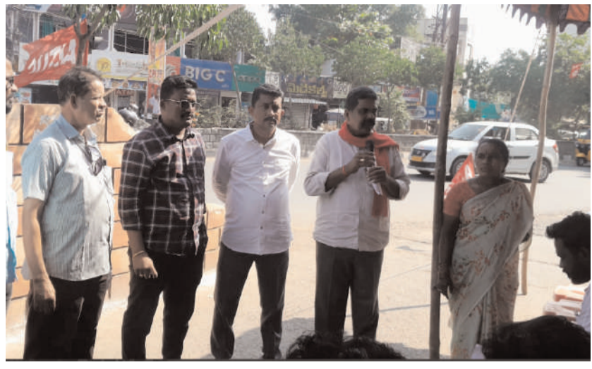
భద్రాద్రి కొత్తగూడెం జిల్లా కొత్తగూడెం/డిసెంబర్ 28/అక్షరం సూన్ : గ్రామ పంచాయతీ కార్యకులతో వెళ్ళినాకరి చేయించుకుంటున్న రాష్ట్ర ప్రభుత్వం వారి సమస్యలను పరిష్కరించడంలో గత ప్రభుత్వంకు తీరునే ప్రదర్శిస్తూ ప్రస్తుత ప్రభుత్వం కూడా అచేరితే వివక్షత ప్రదర్శిస్తుందని విబలీయూసీ జిల్లా అధ్యక్షులు కంచర్ల

- డిమాండ్లు పరిష్కరించకుంటే నిరవధిక సమ్మె తప్పదు... -నిరసన ధీక్షలో విబలీయూసీ జిల్లా అధ్యక్షులు జమలయ్య..