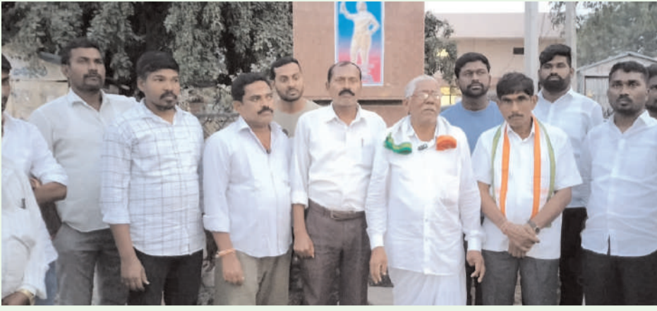
హనుమకొండ/భీమవేదవరపల్లి/డిసెంబర్ 01(అక్షరం న్యూస్):

కొత్తకొండ ఆలయంలో ఇరుపార్టీల తోపులాట దాడిని ఖండించిన కాంగ్రెస్ పార్టీలోని దళిత నాయకులు