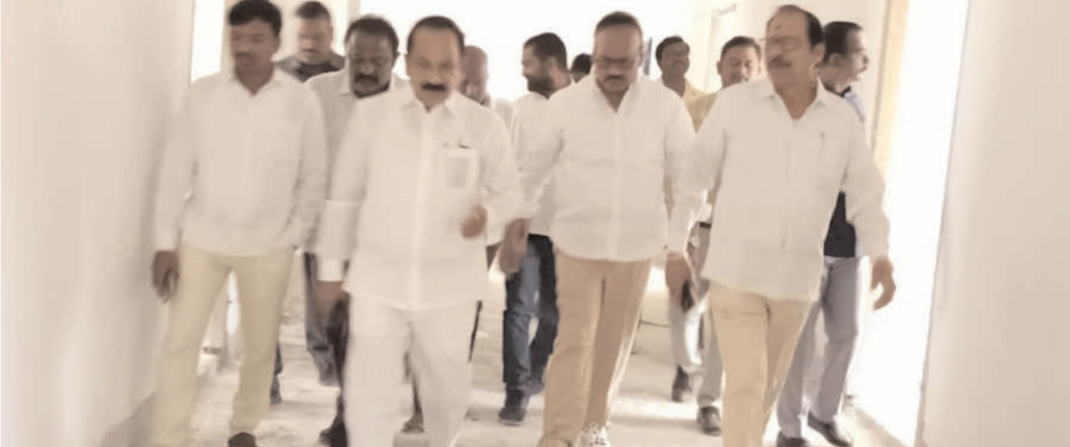
మహబూబాబాద్ బ్యారో అక్షరం స్వయం డిసెంబర్ 1.

-జిల్లా కలెక్టర్ చొరవ చూపి మాకు న్యాయం చేయాలి. -కమిషనర్ పై శాఖపరమైన చర్యలు తీసుకోవాలి.