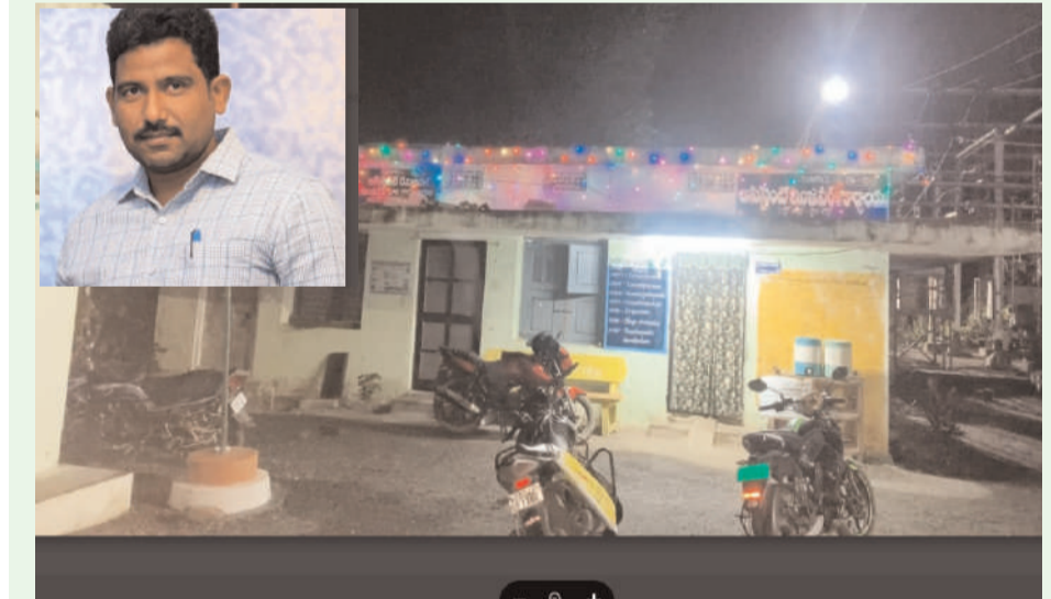
ఖమ్మం/ వైరా డిసెంబర్ 1 (అక్షరం న్యూస్)