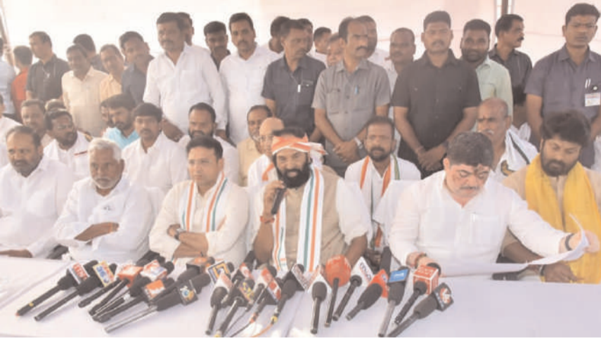
పెద్దపల్లి, ప్రతినిధి డిసెంబర్ -01 అక్షరం సూన్స్

....రాష్ట్ర నీటిపారుదల ,పౌర సరఫరాల శాఖ మంత్రి ఉత్తమ్ కుమార్ రెడ్డి ప్రైవేట్ రంగంలో వేలకోట్ల పెట్టుబడులు సాధిస్తూ యువత ఉపాధి కల్పించేలా కృషి ముఖ్యమంత్రి సభా స్థలిని పరిశీలించి ఏర్పాట్లపై పత్రికా సమావేశం నిర్వహించిన మంత్రి ఉత్తమ్