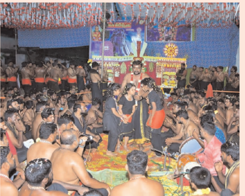
భద్రాద్రి కొత్తగూడెం, పినపాక , డిసెంబర్ 01(అక్షరంస్వయం) :