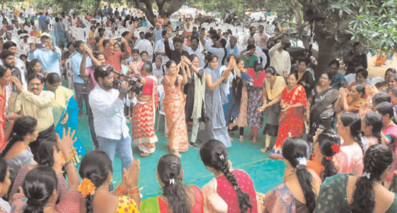
ఖమ్మం/తల్లాడ డిసెంబర్ 1 (అక్షరం న్యూస్)

కులమత కార్యక్రమంలో ప్రజా ప్రతినిధులు పాల్గొనటం నేరం.. మాస్ లైన్ జనభోజనాలలో వక్రలు... జన భోజనాలలో... అంచనాకు మించి పాల్గొన్న ప్రజలు.. జన భోజనాలను అపురూపంగా ఆదరించిన ఖమ్మం ప్రజలు..