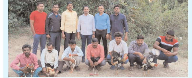
పెద్దపల్లి రూరల్ డిసెంబరు 1 అక్షరం సూన్స్

విడుగురు పందెం రాయుళ్ళ అరెస్ట్ ...పరారీలో మరికొంత మంది 13 పందెం కోళ్ళు ,60 కత్తులు, 05 మొలైల్స్ మరియు 6530/- నగదు స్వాధీనం.