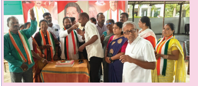
మహాబాబాద్ బ్యారో అక్షరం న్యూస్ డిసెంబర్ 9.