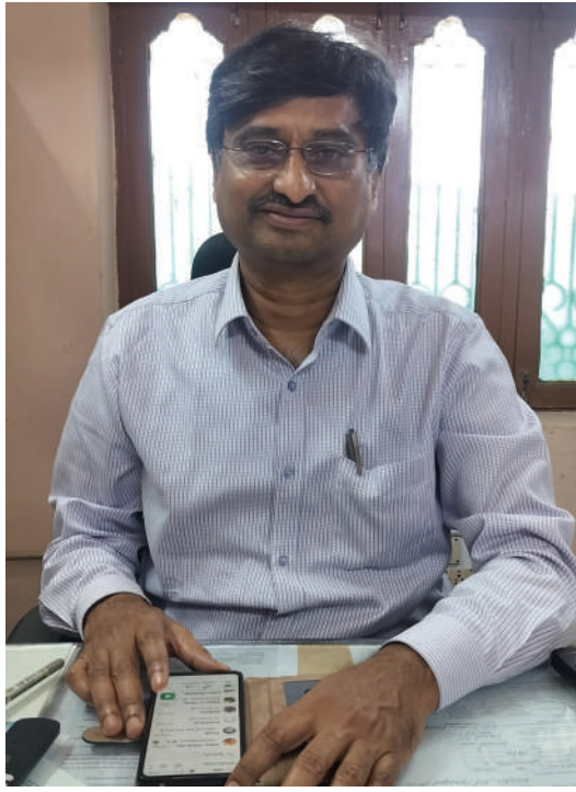
మిగిలిపోతుందని ఆయన తెలిపారు.

పెట్రోల్ డీజిల్ తో నడిచే వాహనాల వల్ల పర్యావరణ కాలుష్యం ఏర్పడి జీవన ప్రమాణ స్థాయి తగ్గిపోతుందని అందుకే ప్రభుత్వం ఎలక్ట్రిక్ వాహనాలను ప్రోత్సహిస్తుందని తెలిపారు. డిసెంబర్ ఇతర దేశాల నుండి దిగుమతి చేసుకుంటున్న పెట్రోల్, డీజిల్ అవసరం లేకుండా పోతుందని విదేశీ మార్గ ద్రవ్యం