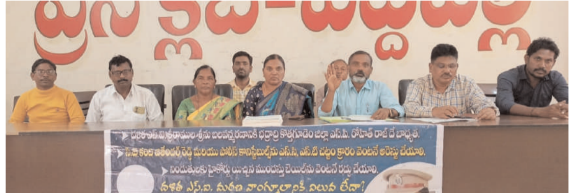
పెద్దపల్లి టౌన్ నవంబర్ 06 అక్షరం స్టూన్స్