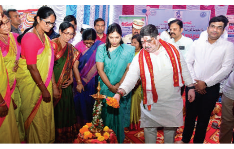
ప్లాస్టిక్ నిషేధాన్ని ఈ సభ ద్వారా ప్రచారం చేయాలి