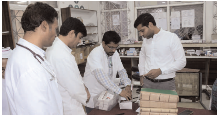
ఖమ్మం / తల్లాడ నవంబర్ 29