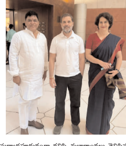
మహబూబాబాద్ బ్యూరో అక్షరం/స్వస్థం సవంబర్ 29.

కాంగ్రెస్ పార్టీ అగ్ర నేత పార్లమెంట్ ప్రతిపక్ష నాయకుడు రాహుల్ గాంధీని మహబూబాబాద్ పార్లమెంట్ సభ్యులు పారిక బలరాం నాయక్ కలిశారు. శుక్రవారం ఢిల్లీలో కాంగ్రెస్ పార్టీ అగ్రనేతలు పార్లమెంట్ ప్రతిపక్ష నేత రాహుల్ గాంధీని, ఇటీవల కేరళ రాష్ట్రంలోని వాయనాడు పార్లమెంటుకు జరిగిన ఉప ఎన్నికల్లో అత్యధిక మెజార్టీతో గెలుపొందిన పార్లమెంటు సభ్యులైన ప్రియాంక గాంధీలను మహబూబా బాద్ పార్లమెంట్ సభ్యులు పారిక బలరాం నాయక్ మధ్యాహ్నం భోజనం చేశారు.