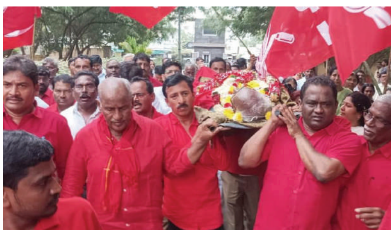
కడపటి వీడోలుకు కదిలొచ్చిన జనం..

అశ్రునయనాల మధ్య పోటు ప్రసాద్ అంతిమ యాత్ర..