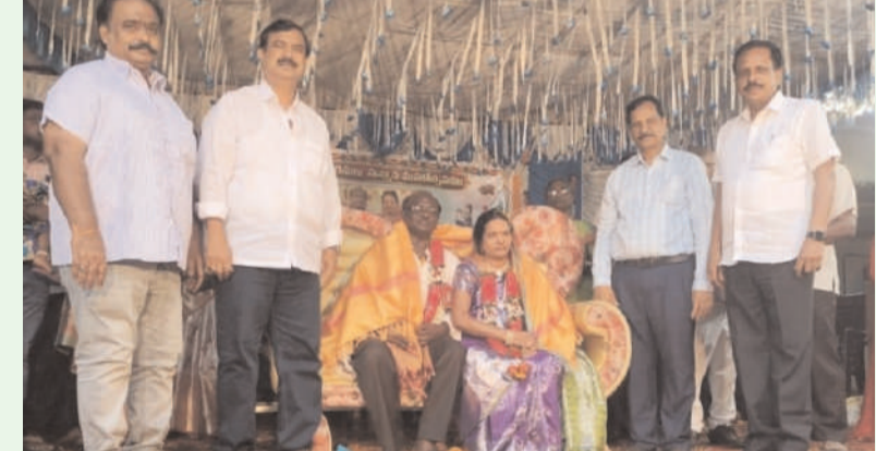
ఖమ్మం/ తల్లాడ సపంబర్ 2