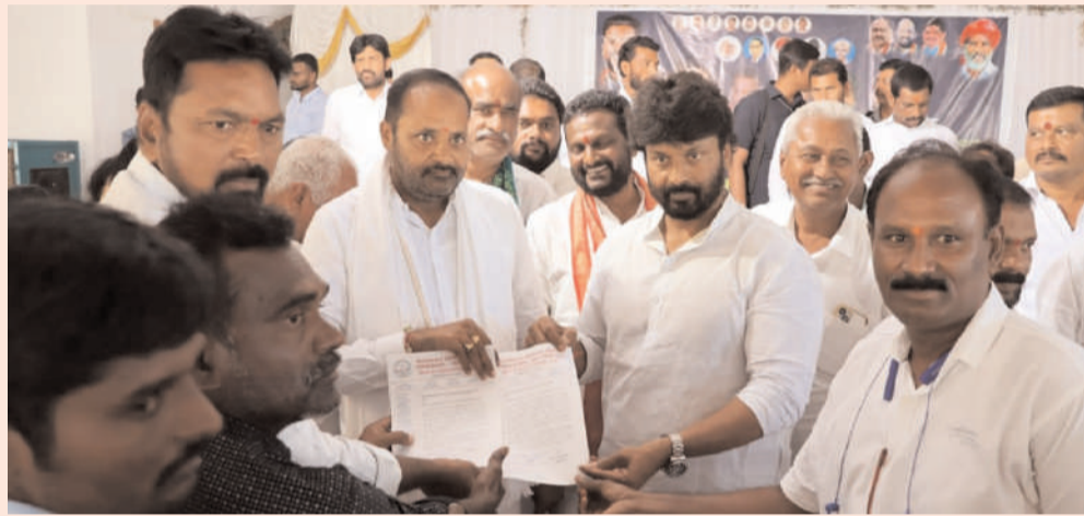
పెద్దపల్లి టౌన్ నవంబర్ 02 అక్షరం న్యూస్