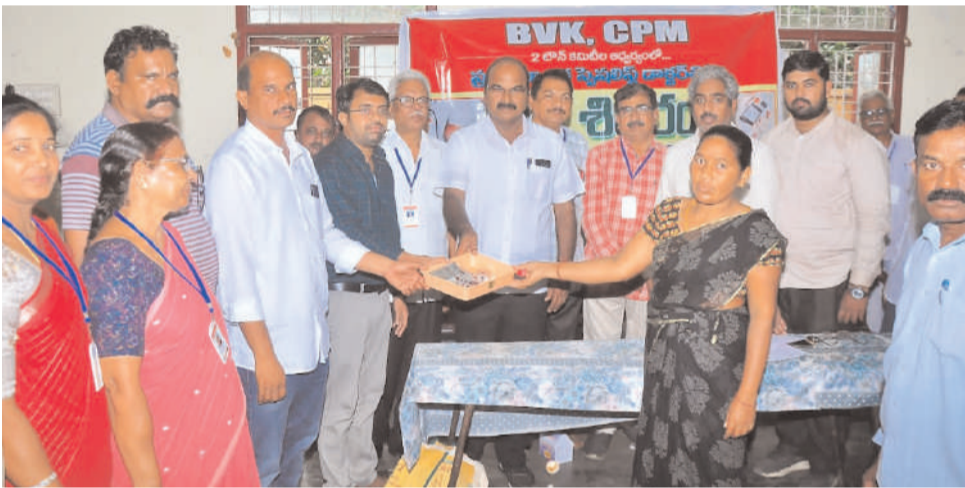
ఖమ్మం/తల్లాడ సపంబర్ 2 (అక్షరంస్వ్యాస్)