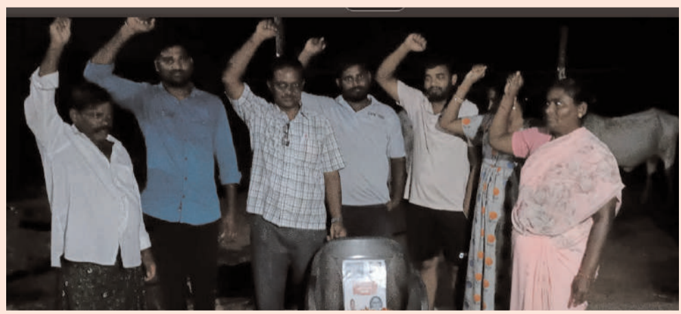
ఖమ్మం/ తల్లాడ నవంబర్ 2 (అక్షరం న్యూస్)