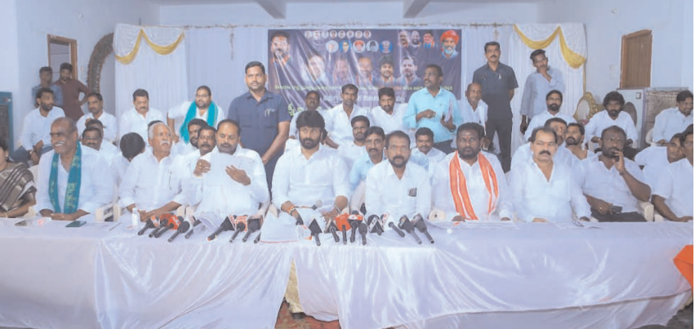
పెద్దపల్లి ప్రతినిధి నవంబర్ 2 అక్షరం న్యూస్