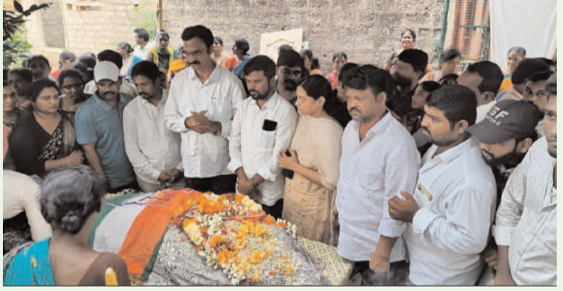
ఖమ్మం/తల్లాడ సపంబర్ 2 (అక్షరంస్వ్యాస్)

తీవ్ర దిగ్భ్రాంతి వ్యక్తం చేసిన మంత్రి పొంగులేటి