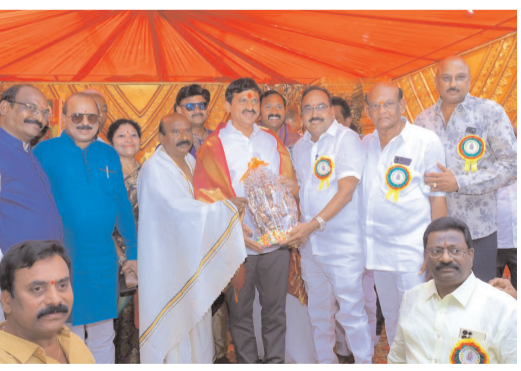
ఖమ్మం/తల్లాడ నవంబర్ 24 (అక్షరంస్వయం)