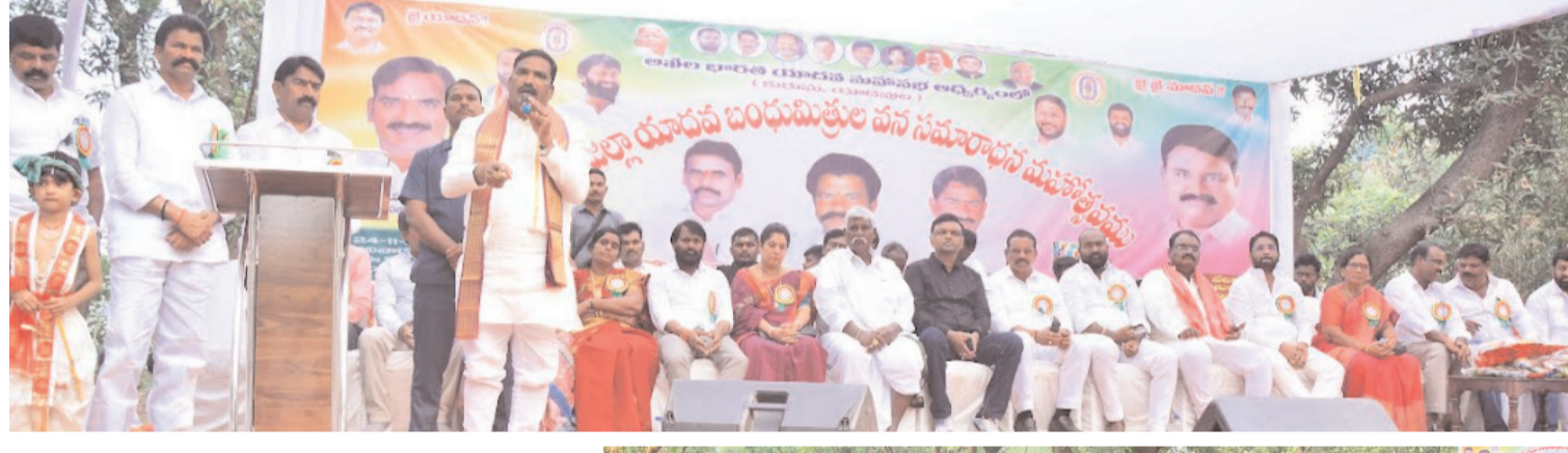
ఘమ్మం/ తల్లాడ సవంబర్ 24 (అక్షరంసూన్)