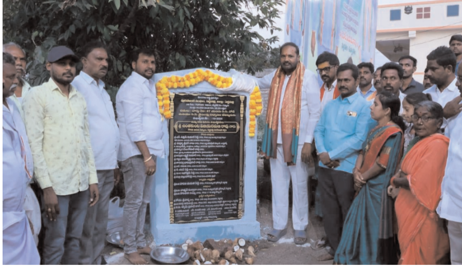
పెద్దపల్లి టౌన్ సవంబర్ 24 అక్షరం సూన్

పెద్దపల్లి ఎమ్మెల్యే విజయరమణ రా గో గోవు రూ.2.11 కోట్లతో అభివృద్ధి పనులకు శంకుస్థాపన.