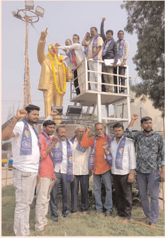
రామగిరి (పెద్దపెల్లి జిల్లా) నవంబర్ 24 అక్షరం స్యూస్: