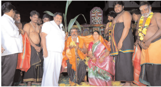
ఘమ్మం/తల్లాడ సవంబర్ 24 (అక్షరంసూన్) తల్లాడ లో శనివారం రాత్రి అయ్యప్ప స్వామి పడిపూజ కార్యక్రమం గనముగా జరిగింది.బొడ్డు మల్లయ్య గురు స్వామి 18 సార్లు మాల వేసిన నందర్లుగా 18 వ పడి నందర్లుగా ఆ స్వామి అయ్యప్ప పడి పూజ కార్యక్రమం ని