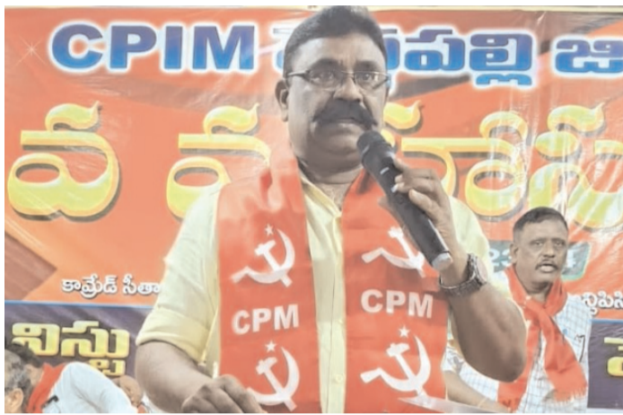
జ్యోతి నగర్ సవంబర్ 24 పెద్దపల్లి జిల్లా అక్షరం స్యూస్ నిపిఎం జిల్లా 3వ మహాసభలు 2వ రోజు కా.సీతారాం ఏచారి ప్రాంగణం (శ్రీ లక్ష్మీ కేశవ ఫంక్షన్ హాల్) ఎన్.టి.పి.సి. లో ఆదివారం జరిగాయి. ఈ సందర్భంగా జిల్లా సమగ్రాభివృద్ధి పై జిల్లా కార్యదర్శి వర్గ