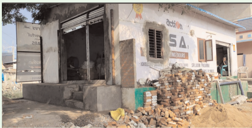
భద్రాద్రి కొత్తగూడెం జిల్లా/బూర్గంపాడు/ నవంబర్-24/అక్షరం/ సూన్/