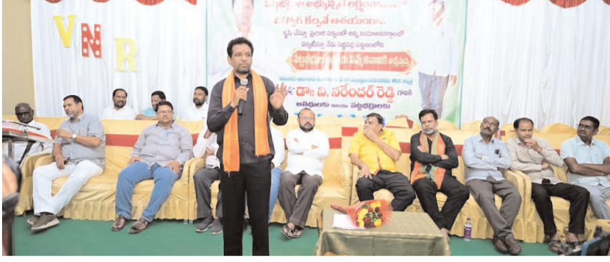
పెద్దపల్లి ప్రతినిధి సవంబర్ 24 అక్షరం సూన్

పెద్ద పల్లి పట్టణ ప్రజల ఆత్మీయ సమ్మేళనంలో అల్పార్థి సరేందర్ రెడ్డి