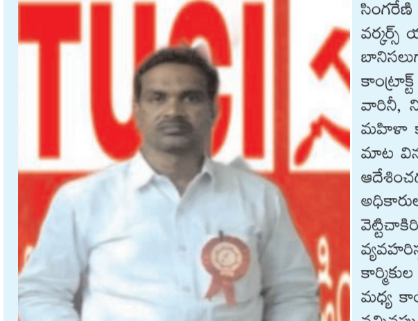
విధానాన్ని స్పష్ట పలకాలని డిమాండ్ చేస్తున్నాం లేనట్లుయితే సింగరేణి వ్యాప్తంగా అధికారుల వైఖరికి నిరసనగా కార్యక్రమాలు కొనసాగుతాయని ఆయన హెచ్చరించారు.

బెదిరింపులతో భయభ్రాంతులకు గురిచేస్తున్న అధికారుల వైఖరి ఖండిస్తున్నాం