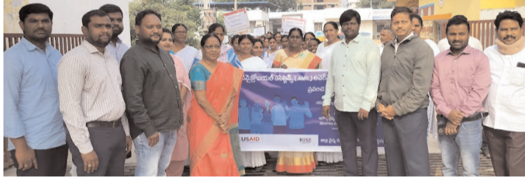
పెద్దపెల్లి టౌన్ నవంబర్ 24 అక్షరం స్యూస్:

... జెండా ఊపి ప్రారంభించిన నా వైద్య ఆరోగ్యశాఖ అధికారి