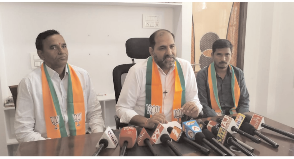
పెద్దపెల్లి టౌన్ నవంబర్ 24 అక్షరం స్యూస్