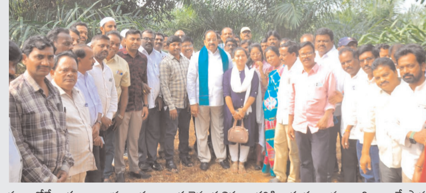
ఖమ్మం/తల్లాడ నవంబర్ 24 (అక్షరంస్వయం)

మంత్రులు పొంగులేటి,తుమ్మల హామి..స్థంభాద్రి జర్నలిస్ట్ సోసైటీకి మంత్రుల అభినందనలు.