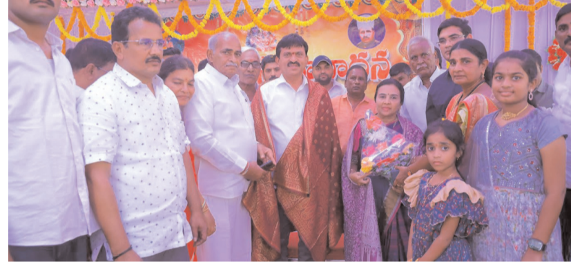
ఖమ్మం/తల్లాడ నవంబర్ 24 (అక్షరంస్వయం)