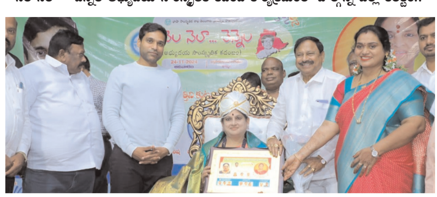
ఖమ్మం/ తల్లాడ నవంబర్ 24 (అక్షరంసూన్)

నెల నెలా - వెన్నెల అభ్యుదయ సాంస్కృతిక కదంబ కార్యక్రమంలో పాల్గొన్న జిల్లా కలెక్టర్..