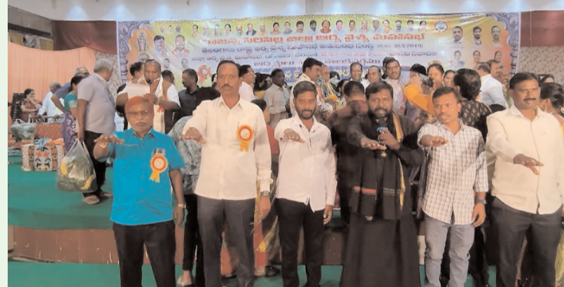
రాజస్థాన్ సిరిసిల్ల /వేములవాడ, నవంబర్ - 25 (అక్షరం సూన్):