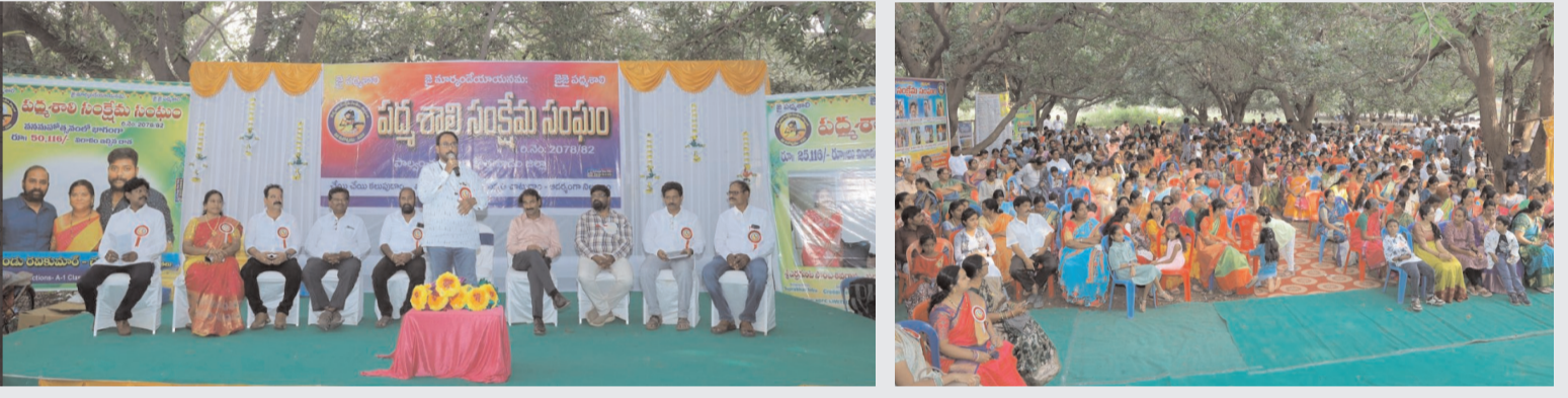
భద్రాద్రి కొత్తగూడెం నవంబర్ 24 (అక్షరంస్వయం)