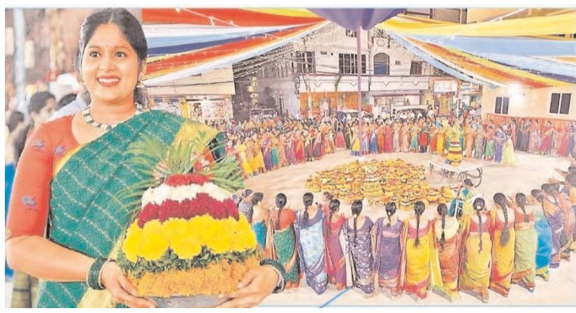
పాడుతూ ఈ పండుగ జరుపుకుంటారు