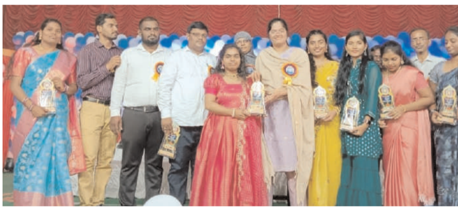
పెద్దపల్లి టౌన్ అక్టోబర్ 29 అక్షరం స్యూస్

..విద్యార్థులు కష్టపడి చదువుకొని ఉన్నత స్థాయికి చేరుకోవాలి