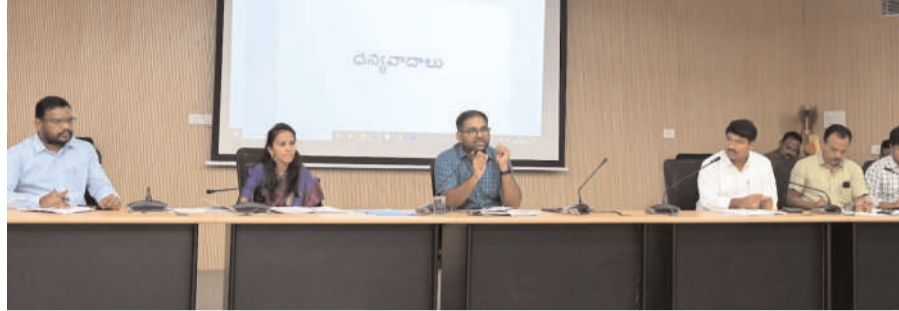
.... జిల్లా కలెక్టర్ కోయ శ్రీ హర్ష లిలిసమగ్ర ఇంటింటి కుటుంబ సర్వే నిర్వహణపై సంబంధిత అధికారులతో రివ్యూ నిర్వహించిన జిల్లా కలెక్టర్ పెద్దపల్లి, ప్రతినధి అక్టోబర్ -29 అక్షరం న్యూస్

రాష్ట్ర ప్రభుత్వ ఆదేశాల మేరకు మన జిల్లాలో చేపడుతున్న సమగ్ర ఇంటింటి కుటుంబ సర్వే (సామాజిక ఆర్థిక, విద్య ,ఉపాధి, రాజకీయ , కుల సర్వే) ను విజయవంతంగా నిర్వహించాలని జిల్లా కలెక్టర్ కోయ శ్రీ హర్ష అన్నారు.మంగళవారం జిల్లా కలెక్టర్ కోయ శ్రీ హర్ష సమీకృత జిల్లా కలెక్టరేట్ లో సమగ్ర ఇంటింటి కుటుంబ సర్వే నిర్వహణపై స్థానిక సంస్థల అదనపు కలెక్టర్ జే.అరుణ శ్రీ తో కలిసి సంబంధిత అధికారులతో సమీక్ష నిర్వహించారు.ఈ సందర్భంగా లిజిల్లా కలెక్టర్ కోయ శ్రీ హర్ష మాట్లాడుతూ, ప్రభుత్వం చేపట్టే సమగ్ర ఇంటింటి కుటుంబ సర్వే ద్వారా లక్షల మంది జీవితాల్లో మార్పు వస్తుందని, అధికారులు వివరాలను సేకరించే క్రమంలో జాగ్రత్తలు పాటించాలని, ప్రతి ఇంటి నుంచి వివరాల సేకరణ జరగాలని అన్నారు. సమగ్ర ఇంటింటి కుటుంబ సర్వేలో భాగంగా సర్వే చేయాల్సిన ఇండ్లను గుర్తిస్తూ స్ట్రీట్ అండ్ ఇంటింటి, ప్రతి ఇంటికి నవంబర్ 2 నాటికి స్ట్రీట్ అండ్ ఇంటింటి కార్యక్రమం పూర్తి కావాలని కలెక్టర్ తెలిపారు. ఎన్యుమరేటర్లకు అవసరమైన సంపూర్ణ సామాగ్రిని అందజేయడం జరుగుతుందని, నవంబర్ 6 నుంచి 15 వరకు సర్వే ప్రక్రియ పూర్తయ్యే విధంగా ప్రణాళిక రూపొందించాలని అన్నారు. ప్రతి రోజు 15 నుంచి 25 కుటుంబాల సర్వే జరిగేలా చూడాలని అన్నారు. ఎన్యుమరేటర్లకు సర్వే నిర్వహించే సమయంలో సంపూర్ణ అవగాహన కలిగి ఉండాలని, సూపర్ వైజర్ లు వారి పరిధిలో గల 10 మంది ఎన్యుమరేటర్ల సర్వే వివరాలను ఎప్పటికప్పుడు క్రాన్ చెక్