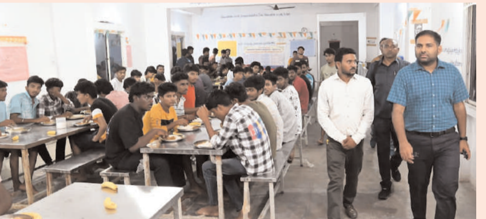
పెద్దపల్లి, ప్రతినధి అక్టోబర్ -29 అక్షరం న్యూస్