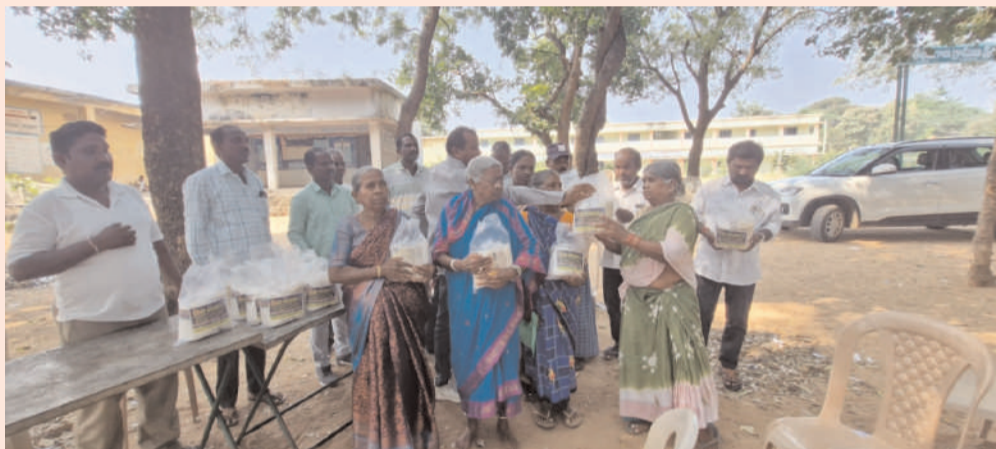
జనగామ జిల్లా / రఘునాథపల్లి/( అక్షరం న్యూస్ ) అక్టోబరు 29