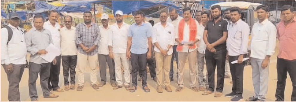
మహబూబాబాద్ జిల్లా/ కొత్త గూడ/ అక్టోబర్ 29(అక్షరం న్యూస్)

పనులు చేయకుండా బిల్లు డ్రా చేసినా కాంట్రాక్టర్లను అరెస్టు చేయాలి లి పంచాయతీ రాజ్ శాఖ AE ని సస్పెండ్ చేయాలి