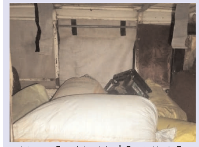
మహబూబాబాద్ జిల్లా/ గంగారం/ అక్టోబర్ 29(అక్షరం స్యూస్)

మహబూబాబాద్ జిల్లా గంగారం మండలంలోని మడగూడెం నుంచి సోమ వారం రాత్రి వాహనంలో అక్రమంగా తరలిస్తున్న 15 క్వింటాళ్ల పీడిఎస్ బియ్యాన్ని గ్రామస్థులు గంగారం సెంటర్లో పట్టుకున్నారు వీటి విలువ సుమారుగా రూ.లక్ష వరకు ఉండొచ్చని అంచనా వంచెం గ్రామానికి చెందిన ఓ.ఆలోడ్రైవర్ గిరిజనుల నుంచి తప్పవరేటుకు పీడిఎస్ బియ్యం కొనుగోలు చేసి ఇల్లందు రైస్ మిల్లర్లకు రూ.30 వరకు విక్రయిస్తున్నట్లు సమాచారం వాహనంతో పాటు డ్రైవర్ వివరాలను స్థానిక ఎస్సై సేకరించినట్లు తెలిపారు ఈకార్యక్రమంలో పోలీసు సిబ్బంది పాల్గొన్నారు