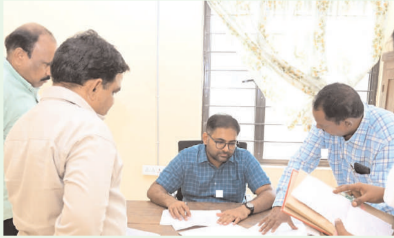
పెద్దపల్లి, ప్రతినిధి అక్టోబర్ -29 అక్షరం స్యూస్

ఇంటింటి సర్వే నిర్వహణ సన్నద్ధతను తనిఖీ చేసిన జిల్లా కలెక్టర్