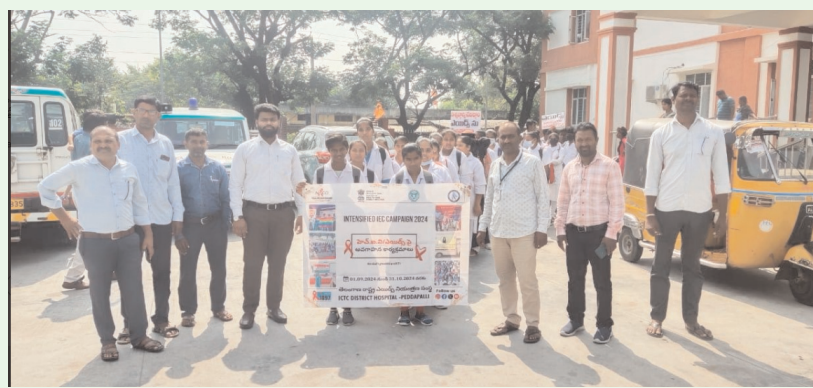
పెద్దపల్లి టౌన్ అక్టోబర్ 25 అక్షరం సన్మానం