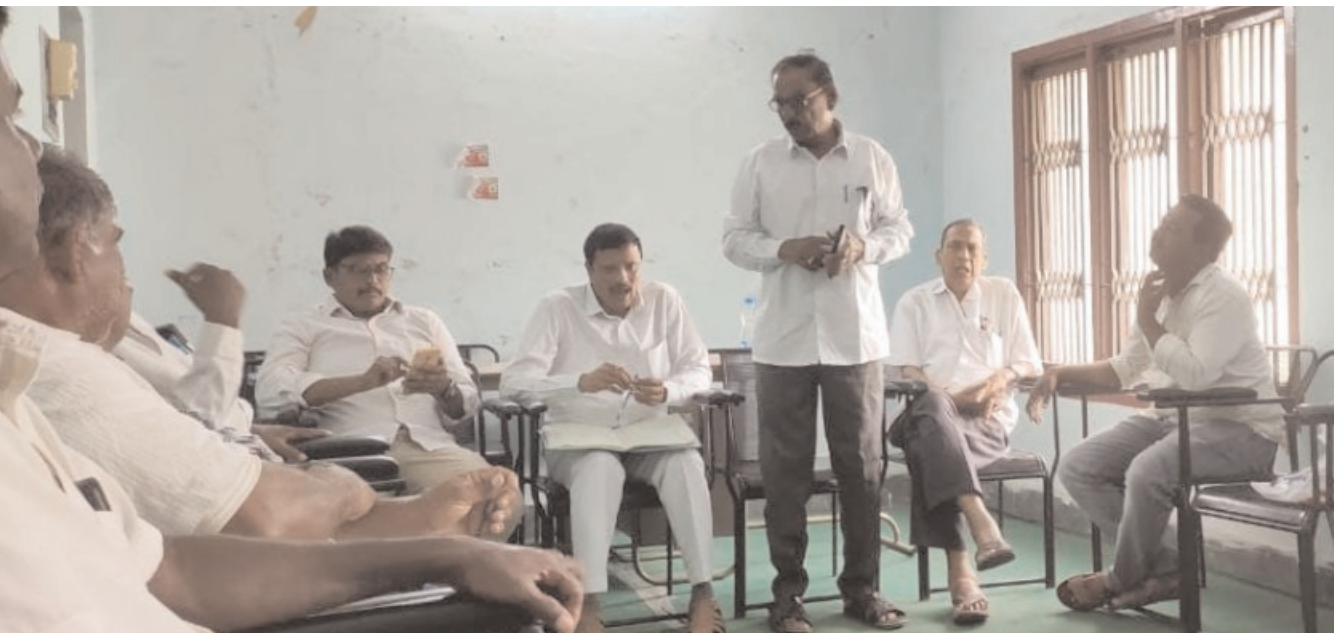
భద్రాద్రి జిల్లా /కొత్తగూడెం/ అక్టోబర్.25/ అక్షరం సన్మాన్: