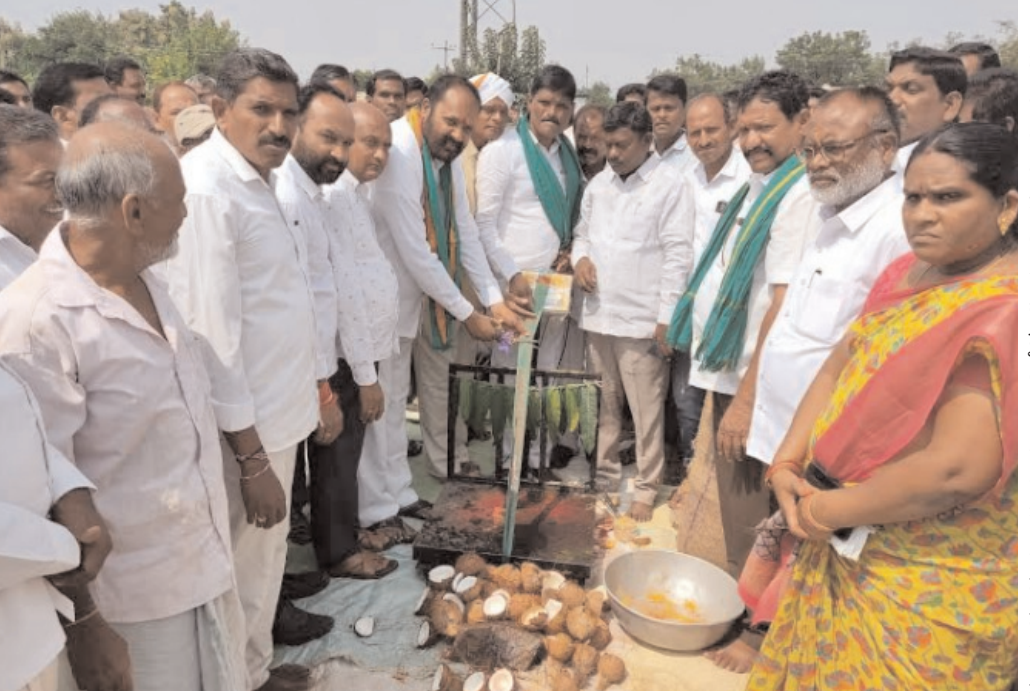
ఓడెల/ పెద్దపల్లి అక్టోబర్ 25 (అక్షరం సూన్)

రైతులను వరి ధాన్యం విషయంలో ఎవరు మోసం చేసిన సహించేది లేదని రైతుల మొఖంలో చిరునవ్వు చూడడమే మా లక్ష్యం అని సన్న రకం వడ్లకు కింటాలుకు 500 బోనస్ ఇవ్వడమే మా లక్ష్యం అందులో ఎలాంటి సందేహం లేదని ఎమ్మెల్యే చింతకుంట విజయ రమణారావు అన్నారు ఈ సందర్భంగా ఓడెల మండలంలోని కొలనూరు గ్రామంలో శుక్రవారం సింగిల్ విండో మరియు ఐకెపి ఆధ్వర్యంలో వరి ధాన్యం కొనుగోలు కేంద్రాలను ప్రారంభించారు ఈ సందర్భంగా ఎమ్మెల్యే విజయరమణ రావు మాట్లాడుతూ.. మరి ధాన్యం కొనుగోలు కేంద్రాల నిర్వహకులకు పలు సూచనలు చేశారు రైతులను మోసం చేస్తే ఎవరిని సహించేది లేదని రైతు కలలో ఆనందం నిండడమే మన లక్ష్యమని ధాన్యం కొనుగోలు విషయంలో 41 కోట్ల మాత్రమే కాంట పెట్టాలని అంతకంటే ఒక గింజ కూడా ఎక్కువ పెట్టిన ఊరుకునే ప్రసక్తే లేదనిమీ విజ్ఞప్తి ఎమ్మెల్యేగా ఉన్నంతకాలం ధాన్యం కోత అనే పదానికి తావు ఇవ్వమని స్పష్టం చేశారు. సీజన్లో కొనుగోలు కేంద్రాలలో తాలు తరుగు పేరుతో ఎక్కడైనా కట్టింగ్ చేస్తే రైతులు తన దృష్టికి తీసుకు వస్తే నన్ను సందించి కొనుగోలు కేంద్రానికి వచ్చామని రైతులకు హామీ ఇచ్చారు. సన్న రకాల ధాన్యానికి క్వింటాలుకు ?500 /- రూపాయల బోనస్ చెల్లిస్తామని రైతులు ఎలాంటి సందేహాలకు పాల్పడవద్దన్నారు. కాంగ్రెస్ పార్టీ సీఎం రేవంత్ రెడ్డి రైతుల అభ్యున్నతి కోసం పాటు