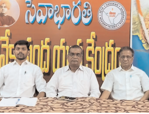
భద్రాద్రి జిల్లా /కొత్తగూడెం/ అక్టోబర్.25/ అక్షరం సన్మాన్:

నవంబర్ 1నుంచి 10వ తరగతి విద్యార్థులకు ఉచిత బోధన