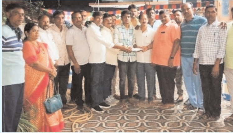
కొడకండ్ల, అక్టోబర్ 25 (అక్షరం సూన్):