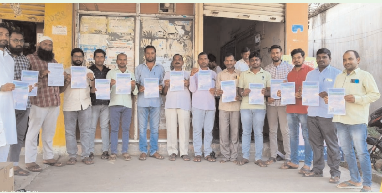
పెద్దపల్లి టౌన్ అక్టోబర్ 25 అక్షరం సన్మానం