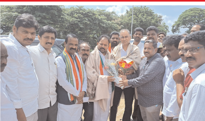
ఖమ్మం/ వైరా అక్టోబర్ 19 (అక్షరం:సూన్)