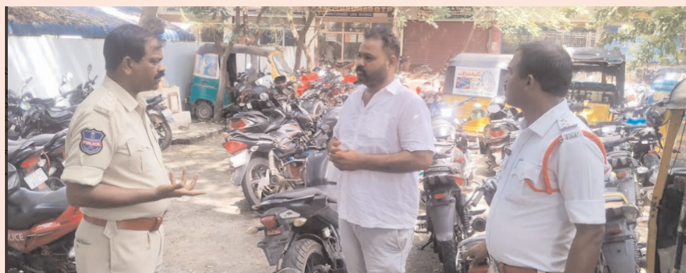
ఖమ్మం/తల్లాడ అక్టోబర్ 19 (అక్షరం న్యూస్)