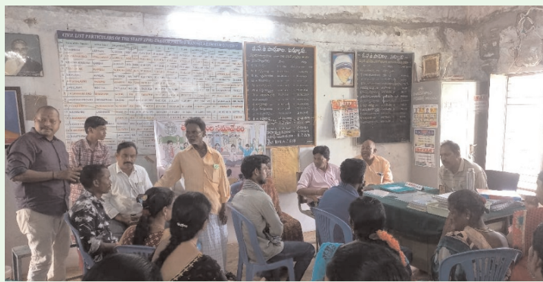
ఖమ్మం/తల్లాడ అక్టోబర్ 19 (అక్షరం:సూన్)