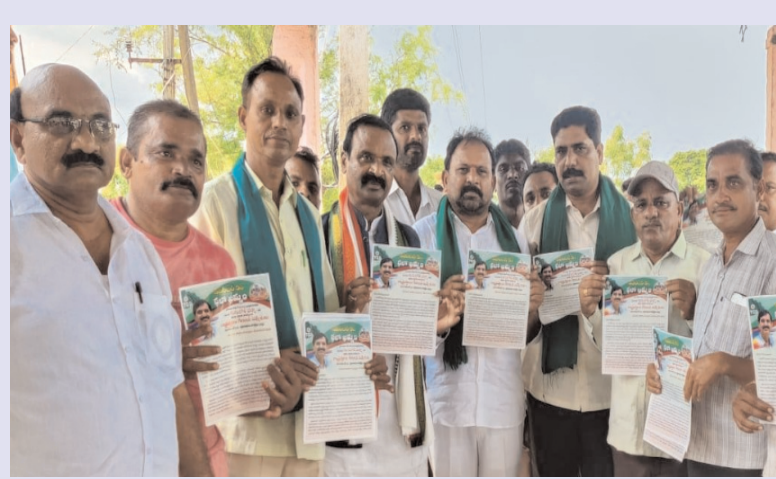
ఖమ్మం/ వైరా అక్టోబర్ 19 (అక్షరం:సూన్)

ఆహ్వాన సంఘం అధ్యక్షులు వైరా ఎమ్మెల్యే మాలోతు రాందాస్ నాయక్