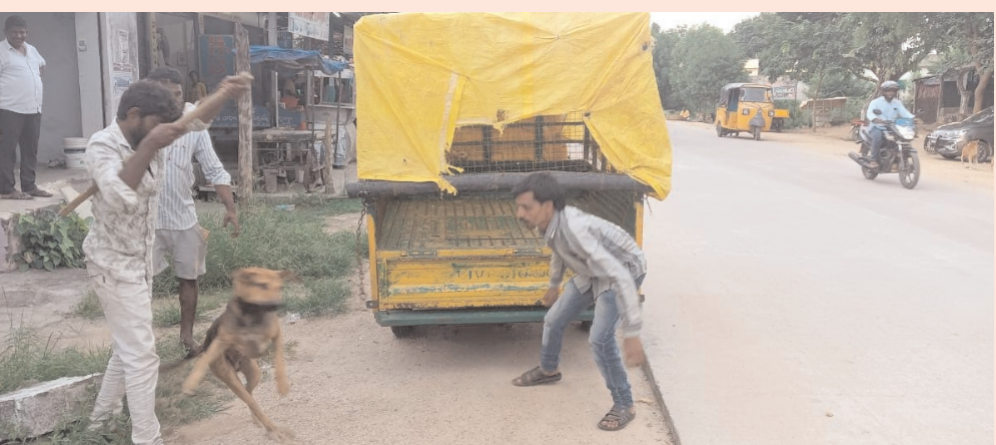
హనుమకొండ/భీమదేవరపల్లి/అక్టోబర్ 19(అక్షరం న్యూస్):

హనుమకొండ జిల్లా భీమదేవరపల్లి మండలం ములుకనూరులో కొన్నిరోజులుగా వీధి కుక్కల దాడులతో జనం బెంబేలెత్తిపోయారు. ఈనెల 16 వలపురుపై కుక్కలు మూకుమ్మడిగా దాడి చేయడంతో తీవ్రంగా గాయపడ్డారు. కాగా గ్రామ పంచాయతీ అధికారులు కుక్కల నివారణకు ప్రత్యేక బృందాలను రప్పించి పట్టుకున్నారు. మార్కెట్ ప్రాంతంలో మాంసం వ్యర్థాల రోడ్లపై వేయడం వల్ల కుక్కలు గుంపులుగా చేరి, వచ్చినోయే వారిపై దాడులు చేస్తున్నాయి. మాంసం వ్యాపారులు మాంసం వ్యర్థాలు రోడ్లపై వేయకుండా గ్రామ పంచాయతీ అధికారులు చర్యలు తీసుకోవాలని స్థానికులు కోరుతున్నారు.