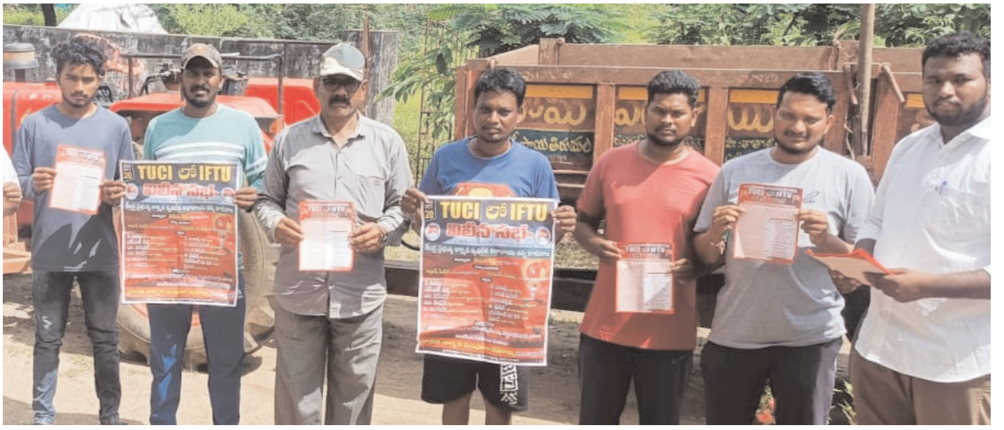
ఖమ్మం/తల్లాడ అక్టోబర్ 18 (అక్షరంస్వాస్)