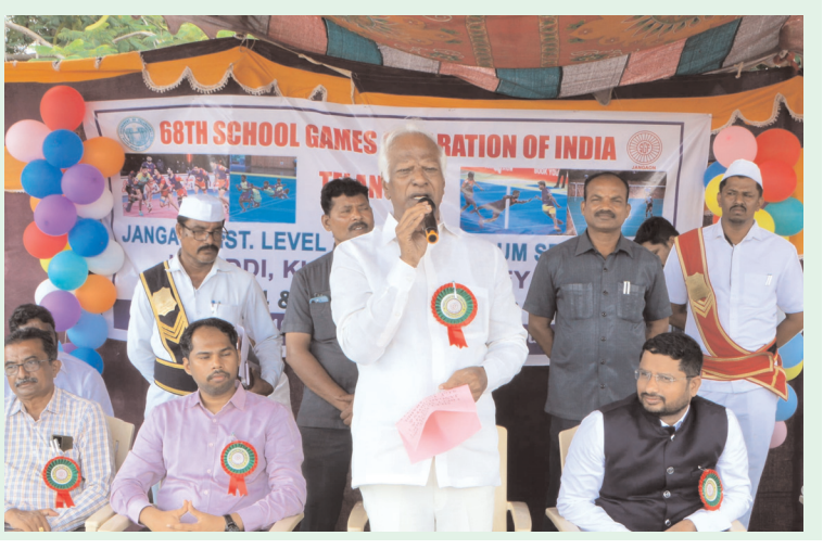
ఖమ్మం/తల్లాడ అక్టోబర్ 18 (అక్షరంస్వాస్)

జనగామ జిల్లా/రఘునాథపల్లి/ (అక్షరం స్వాస్ ) అక్టోబర్ 18: విద్యార్థుల చదువుతోపాటు క్రీడల్లోనూ రాణించాలని మాజీ ఉపముఖ్యమంత్రి, స్టేషన్ ఘనపూర్ శాసనసభ్యులు కడియం శ్రీహరి అన్నారు. శుక్రవారం జనగామ జిల్లా కేంద్రంలోని ధర్మకచే మిని స్టేడియంలో న్యూజ్ గేమ్స్ ఫెడరేషన్ ఆఫ్ ఇండియా-68వ క్రీడా పోటీలను అధికారులు, స్థానిక నాయకులతో కలిసి ఎమ్మెల్యే కడియం శ్రీహరి ప్రారంభించారు. ఈ సందర్భంగా క్రీడల్లో పాల్గొంటున్న విద్యార్థులచే ఎమ్మెల్యే గౌరవ వందనం స్వీకరించారు. ఈ సందర్భంగా ఏర్పాటు చేసిన సమావేశంలో ఎమ్మెల్యే శ్రీహరి మాట్లాడుతూ రాష్ట్ర ప్రభుత్వం విద్యతోపాటు క్రీడలకు ప్రోత్సాహం ఇస్తున్నదని విద్యార్థులు క్రీడాకారులను తయారు చేయాలని తెలిపారు. పోటీ తర్వాత ఉంటేనే క్రీడల్లో మరింతగా రాణించగలుగుతారని అన్నారు. విద్యార్థులు క్రీడాస్ఫూర్తిని అలవర్చుకోవాలని ఈ సందర్భంగా ఎమ్మెల్యే సూచించారు.