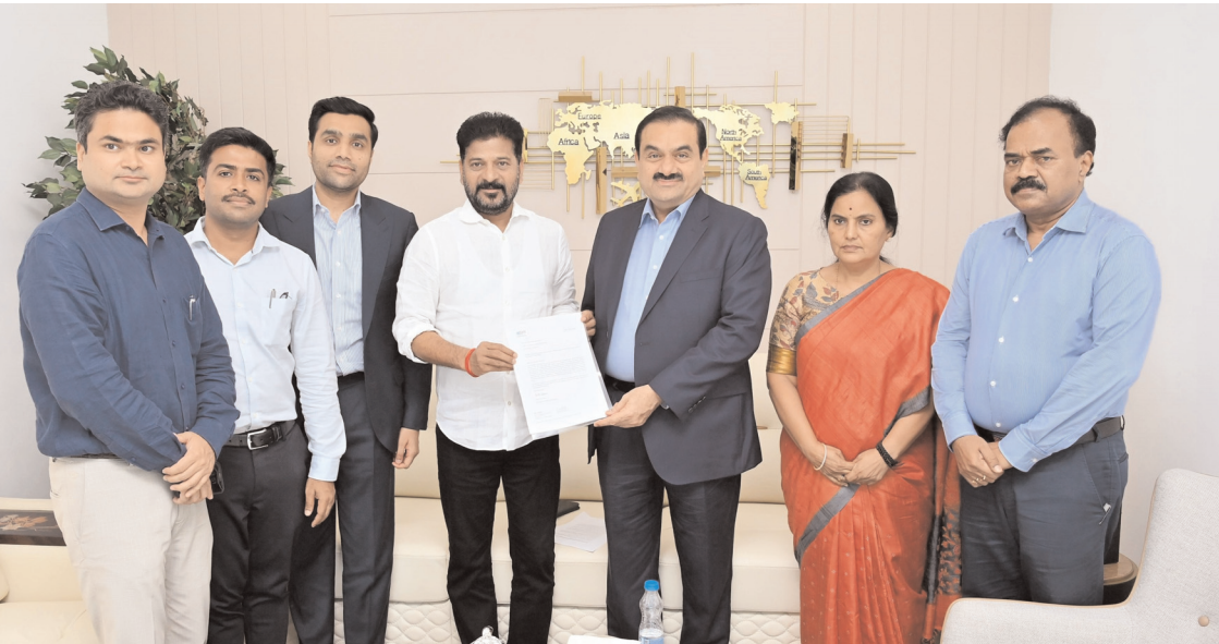
చేశారు. 'ఆదానీ గ్రూప్ సంస్థల చైర్మన్ శ్రీ గౌతమ్ ఆదానీ గారు మర్యాదపూర్వకంగా కలిశారు. ఆదానీ ఫౌండేషన్ నుంచి యంగ్ ఇండియా స్కిల్స్ యూనివర్సిటీకి రూ.100కోట్ల విరాళం చెక్కు రూపంలో అందజేశారు.' అని ముఖ్యమంత్రి టీవీలో పేర్కొన్నారు.

కల్పించనున్నారు. ఏటా లక్షలమందికి శిక్షణ ఇచ్చేలా రాబోయే కాలంలో ఈ వర్కిటీని విస్తరించనున్నారు. బేగంపల్లిలో సొంత భవనం పూర్తయ్యే వరకు గట్టిపాటిలోని ఇంజనీరింగ్ స్టాఫ్ కాలేజీ ఆఫ్ ఇండియా భవనంలో వర్కిటీ కార్యకలాపాలు కొనసాగనున్నాయి. ఈ ఏడాది నుంచే ప్రవేశాలు కల్పించే ఉద్దేశంతో ఇప్పటికే దరఖాస్తులు స్వీకరిస్తున్నారు. నవంబరు 4వ తేదీ నుంచి స్కిల్ యూనివర్సిటీలో కోర్సులు ప్రారంభం కానున్నాయి. ప్రస్తుతానికి ప్రాధాన్యం ఉన్న ఆరు కోర్సులతో మొదలు పెట్టి క్రమంగా కోర్సులను పెంచనున్నారు. ఈ వర్కిటీకి ప్రముఖ పారిశ్రామికవేత్త అనంద్ మహేంద్రా చైర్మన్ గా వ్యవహరిస్తున్నారు. ఇప్పటికే ప్రభుత్వం డీనికోసం వందకోట్లు కేటాయించింది. ఈ క్రమంలో ఆదానీ గ్రూప్ చైర్మన్ గౌతం ఆదానీ నేతృత్వంలో ఓ ప్రతినిధులు బృందం శుక్రవారం తెలంగాణ ముఖ్యమంత్రి రేవంత్ రెడ్డిని కలుసుకుంది. తెలంగాణలో స్కిల్ యూనివర్సిటీని ఏర్పాటు చేయడానికి తెలంగాణ ప్రభుత్వానికి రూ. 100 కోట్లను విరాళంగా ఇచ్చారు. దానికి సంబంధించిన చెక్కును ఆదానీ సిఎం రేవంత్ రెడ్డికి స్వయంగా అందజేశారు. రాజశిఖర్ అండ్ ఈ-కామర్స్, హెల్త్ కేర్, సూట్ ఆఫ్ ఫార్మాస్యూటికల్స్ అండ్ లైఫ్ సైన్సెస్ ఆఫ్ డిజిటల్ పబ్లికేషన్లు, టీవీంగ్ సైతం నడుస్తోంది. ఈ సందర్భంగా తెలంగాణ సిఎం ఎక్స్ లో టీవీ