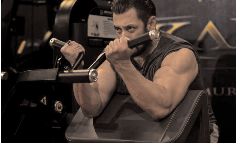
పెంచింది. ఇదిలాఉండగా.. సల్మాన్ ఖాన్ స్నేహితుడు, ఎన్టీవీ నేత బాబా సిద్దిఖీ గతవారం దారుణ హత్యకు గురైన సంగతి తెలిసింది. ముంబయిలోని బాంద్రాలో తన కుమారుడి కార్యాలయంలో ఉండగా.. ముగ్గురు దుండగులు సిద్దిఖీపై మూడు రౌండ్లు కాల్చులు జరిపారు. వెంటనే ఆయన్ను లీలావతి ఆస్పత్రికి తరలించగా.. చికిత్స పొందుతూ మృతి చెందారు. ఈ హత్య తామే చేసినట్లు బిష్టోయ్ గ్యాంగ్ ప్రకటించుకుంది.

ముంబై, అక్టోబర్ 18: బాలీవుడ్ నటుడు సల్మాన్ ఖాన్ కు మరోసారి బెదిరింపులు వచ్చాయి. లారెన్స్ బిష్టోయ్ గ్యాంగ్లో ఉన్న వైరానికి ముగింపు పలకాలంటే రూ.5 కోట్లు ఇవ్వాలంటూ అగంతకులు బెదిరింపులకు పాల్పడ్డారు. ముంబయి ట్రాఫిక్ పోలీసుల వాట్సప్ నంబర్ కు ఈ మెసేజ్ రావడంతో పోలీసులు అప్రమత్తమయ్యారు. గురువారం రాత్రి ముంబయి ట్రాఫిక్ పోలీసులకు ఈ మెసేజ్ వచ్చింది. 'ఈ బెదిరింపులను తేలిగ్గా తీసుకోవద్దు. సల్మాన్ ఖాన్ ప్రాణాలతో ఉండాలన్నా. లారెన్స్ బిష్టోయ్ గ్యాంగ్లో శత్రుత్వాన్ని ముగించుకోవాలన్నా ఆయన రూ.5కోట్లు చెల్లించాలి. ఈ డబ్బులు ఇవ్వకపోతే ఇటీవల హత్యకు గురైన మాజీ ఎమ్మెల్యే సిద్దిఖీ కంటే ఆయన దారుణమైన పరిస్థితులు ఎదుర్కోవాలి' ఉంటుందని దుండగులు అందులో బెదిరించారు. దీనిపై కేసు నమోదు చేసుకొని దర్యాప్తు ప్రారంభించామని, మెసేజ్ ఎక్కడినుంచి వచ్చిందన్న దానిపై విచారణ జరుపుతున్నామని ముంబయి పోలీసులు వెల్లడించారు. ఈ నేపథ్యంలో బాంద్రాలోని ఆయన నివాసం వద్ద భద్రతను కట్టుదిట్టం చేశారు. కాగా.. సల్మాన్ ఖాన్ కు ఇలా బెదిరింపులు రావడం ఇదే తొలిసారి కాదు. గతంలోనూ పలుమార్లు బిష్టోయ్ గ్యాంగ్ నుంచి ఆయనకు బెదిరింపులు వచ్చాయి. ఈ ఏడాది ఏప్రిల్ లో సల్మాన్ నివాసం ఉంటున్న బాంద్రాలోని గెలాక్సీ అపార్ట్ మెంట్ వద్ద ఇద్దరు వ్యక్తులు కాల్చులు జరిపిన సంగతి తెలిసిందే. ఇది, అంతకుముందు పన్నేల్ ఫామిలీస్ లోకి చొరబడేందుకు ఆడదరు ప్రయత్నించడం అప్పుడే కలకలం రేపింది. నటుడి ప్రాణాలకు ముప్పు పొంది ఉన్న నేపథ్యంలో గతేడాది మహారాష్ట్ర ప్రభుత్వం ఆయనకు భద్రతను