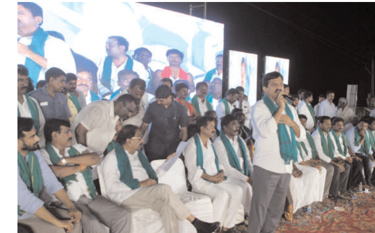
ఖమ్మం /తెలంగాణ, అక్టోబర్ 10 (అక్షరం/న్యూస్)

రాష్ట్ర మంత్రులు తుమ్మల నాగేశ్వర రావు, పొంగులేటి శ్రీనివాసరెడ్డి సంక్రాంతి నాటికి మద్దులపల్లి మార్కెట్ యార్డ్ పెండింగ్ పనులు పూర్తి.. సన్న రకం వడ్లకు క్వింటాల్ 500 రూపాయల బోనస్.. రైతులకు పూర్తి ప్రీమియం ప్రభుత్వమే చెల్లించి పంటల బీమా పథకం అమలు.. రైతులు లాభదాయక పంట ఆయిల్ పామ్ సాగుకు ముందుకు రావాలి.. మద్దులపల్లి వ్యవసాయ మార్కెట్ యార్డు కమిటీ ప్రమాణ స్వీకార కార్యక్రమంలో పాల్గొన్న మంత్రులు..