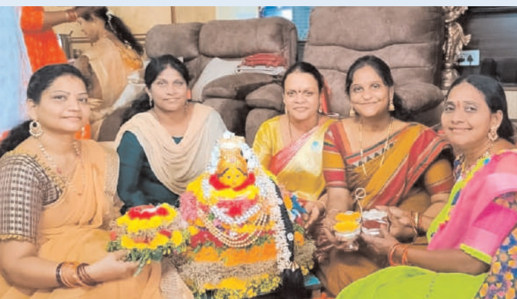
ఖమ్మం/తెలంగాణ అక్టోబర్ 10 (అక్షరం/న్యూస్)