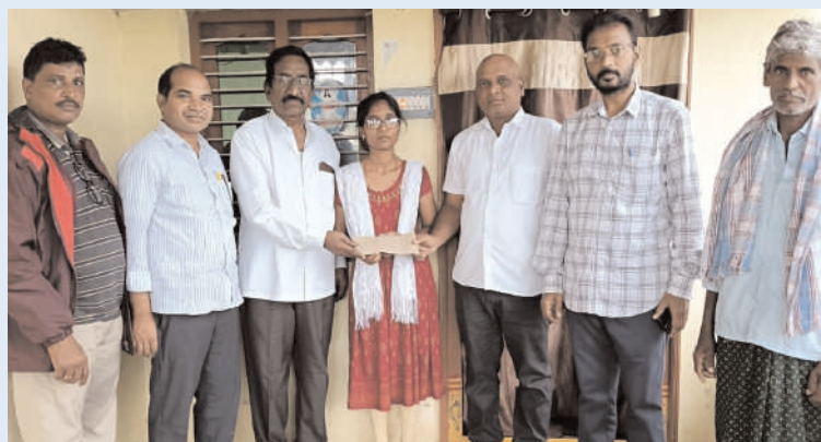
ఖమ్మం/తెలంగాణ అక్టోబర్ 10 (అక్షరం/న్యూస్)