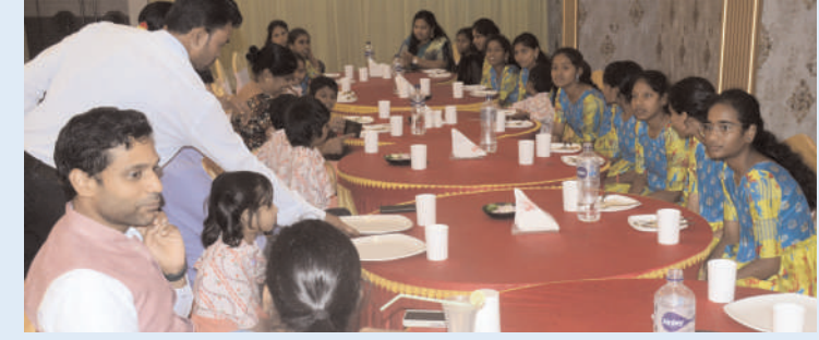
ఖమ్మం/ తెలంగాణ అక్టోబర్ 10 (అక్షరం/న్యూస్)

జిల్లా కలెక్టర్ ముజమ్మిల్ ఖాన్.. అనాథలనే భావన మనస్సు నుండి తీసివేయాలి.. జిల్లా యంత్రాంగం మీతో ఉన్నారనే ధైర్యంతో ముందుకు సాగాలి.. బాలసదనం పిల్లలతో కలిసి భోజనం చేసిన జిల్లా కలెక్టర్