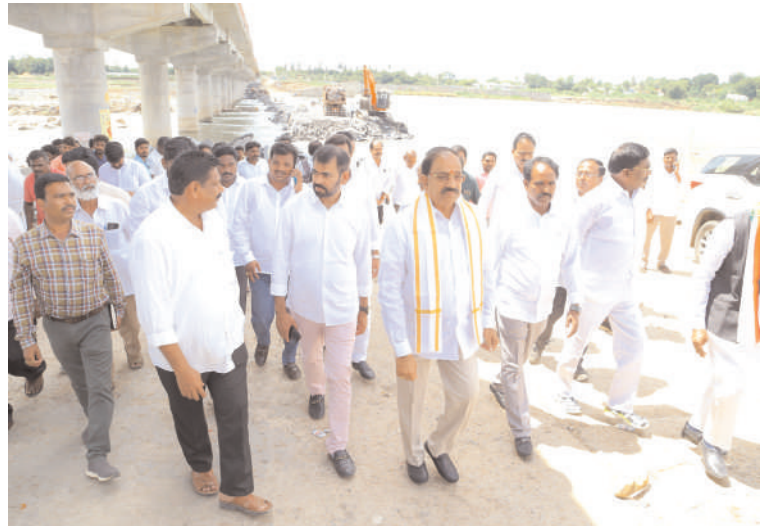
ఖమ్మం /తల్లాడ అక్టోబర్ 10 (అక్షరంస్వ్యాం)

రాష్ట్ర వ్యవసాయ, మార్కెటింగ్, సహకార, చేనేత, జోళి శాఖామంత్రులు తుమ్మల నాగేశ్వర రావు రఘునాథపాలెం మండలంలోని పలు గ్రామాలలో పర్యటించి అభివృద్ధి పనులకు శంకుస్థాపన చేసిన మంత్రి తుమ్మల..