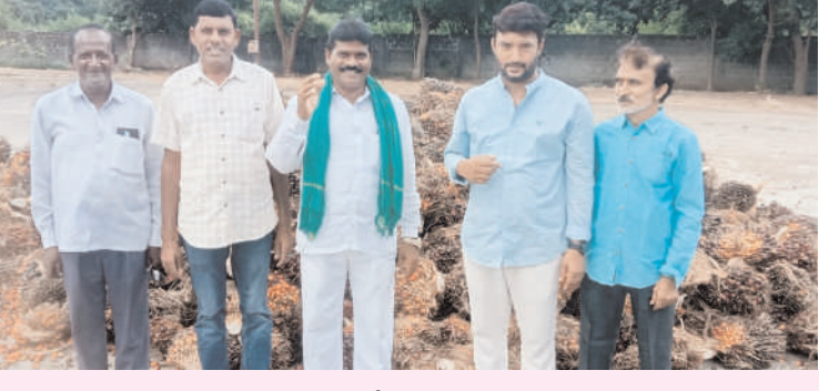
ఖమ్మం/ తల్లాడ అక్టోబర్ 10 (అక్షరంన్యూస్)