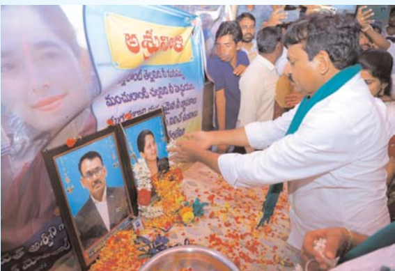
ఖమ్మం/ వైరా సెప్టెంబర్ 4