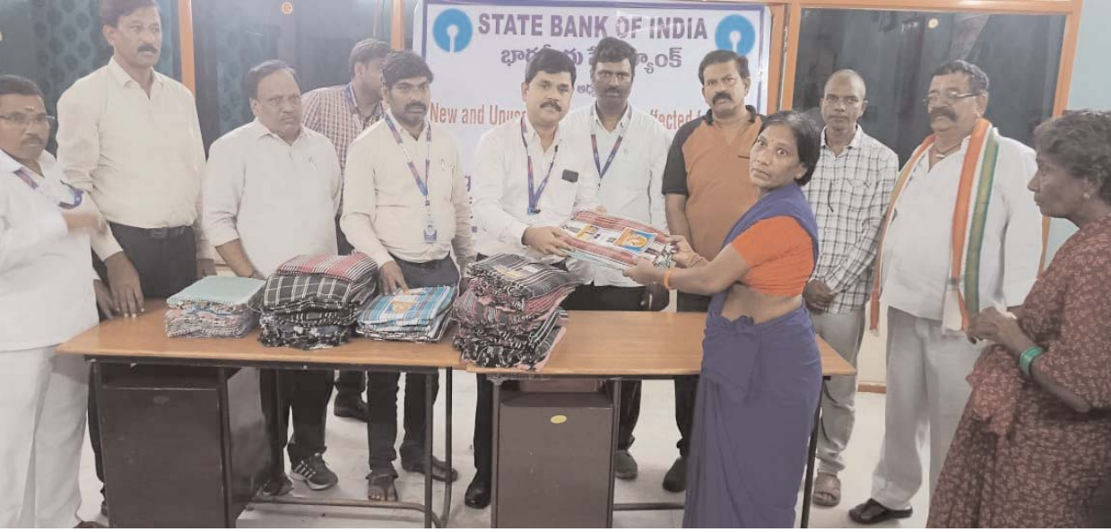
ఖమ్మం/ తల్లాడ సెప్టెంబర్ 4 ( అక్షరం న్యూస్):

భారతీయ స్టేట్ బ్యాంక్ ఖమ్మం రీజియన్ నల్గొండ ఏఓ ఆధ్వర్యంలో కలెక్ట్ చేసిన బట్టలు, వరద ల వల్ల ఇబ్బందులు పడుతున్న పునరావాస కేంద్ర లో ఉన్న