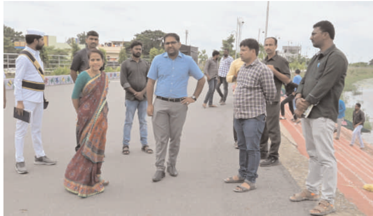
పెద్దపల్లి, ప్రతినిధి ఆగస్టు - 01 అక్షరం సూన్స్

పెద్దపల్లి పట్టణంలో నిర్వహిస్తున్న నూతన మున్సిపల్ కార్యాలయాన్ని ఆగస్టు నెలలో ప్రారంభించాలని, ఆ దిశగా పెండింగ్ పనులు, గ్రీనరీ పనులు త్వరితగతిన పూర్తి చేయాలని జిల్లా కలెక్టర్ కోయ శ్రీ హర్ష సంబంధిత అధికారులను ఆదేశించారు. గురువారం జిల్లా కలెక్టర్ కోయ శ్రీ హర్ష స్థానిక సంస్థల అదనపు కలెక్టర్ జె.అరుణ శ్రీ తో కలిసి పెద్దపల్లి పట్టణంలో విస్తృతంగా పర్యటించి పురపాలక కార్యాలయంలో పట్టణ అభివృద్ధి పనుల పై సమీక్ష నిర్వహించారు. ఎల్లమ్మ చెరువును పరిశీలించిన కలెక్టర్ మిసి ట్యాంక్ బండ్ ను మరింత అభివృద్ధి చేసేందుకు ప్రణాళికలు రూపొందించాలని అధికారులకు సూచించారు. మిసి ట్యాంక్ బండ్ వద్ద టాయిలెట్ల నిర్మించాలని కలెక్టర్ తెలిపారు. మిసి ట్యాంక్ బండ్ బోడింగ్ నిర్వహణ కోసం అవసరమైన జెడ్డి లో త్వరితగతిన తెప్పించాలని, మిసి ట్యాంక్ బండ్ పరిసరాలను పరిశుభ్రంగా ఉంచుకోవాలని కలెక్టర్ అధికారులకు సూచించారు.