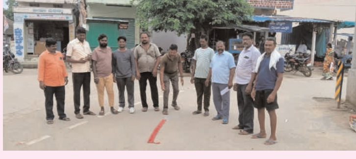
మహబూబాబాద్ /గార్ /ఆగస్టు1/అక్షరం సూన్స్...

సంబంధాలు జరుపుకున్న ఎమ్మార్సీఎస్ నాయకులు ఎమ్మార్సీఎస్ సుదీర్ఘ శాంతియుత పోరాటానికి న్యాయం చేసిన ధన్యవాదం గిన్నారపు మురళి తారక రామారావు ఎమ్మార్సీఎస్ సీనియర్ నాయకులు