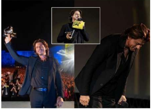
He's truly the Picasso of making India proud. 🇮🇳

అప్పుడు అందుకున్నారు. ఇలాంటి గౌరవాన్ని పొంది చరిత్ర సృష్టించిన మొదటి భారతీయ నటుడిగా షారుఖ్ ఖాన్ నిలిచారు. సినీమాల విషయానికొస్తే.. సుజోయ్ ఘోష్ దర్శకత్వంలో షారుఖ్ 'కింగ్'లో నటించనున్నారు.