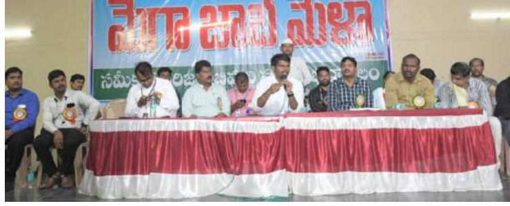
విజయవంతమైన జాబ్ మేళా