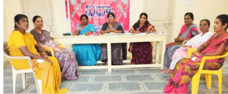
బడ్జెట్ లో విద్యా, వైద్యానికి నిధులు పెంచాలి..

బడ్జెట్ లో విద్యా, వైద్యానికి నిధులు పెంచాలి.. బడ్జెట్ లో విద్యా, వైద్యానికి నిధులు పెంచాలి.. బడ్జెట్ లో విద్యా, వైద్యానికి నిధులు పెంచాలి.. బడ్జెట్ లో విద్యా, వైద్యానికి నిధులు పెంచాలి..