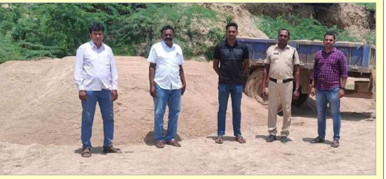
రెండు ఇసుక డంపులను పట్టుకున్న సిద్దిపేట ట్యాంక్ ఫోర్స్ మలయు బెజ్జంకి పోలీసులు.