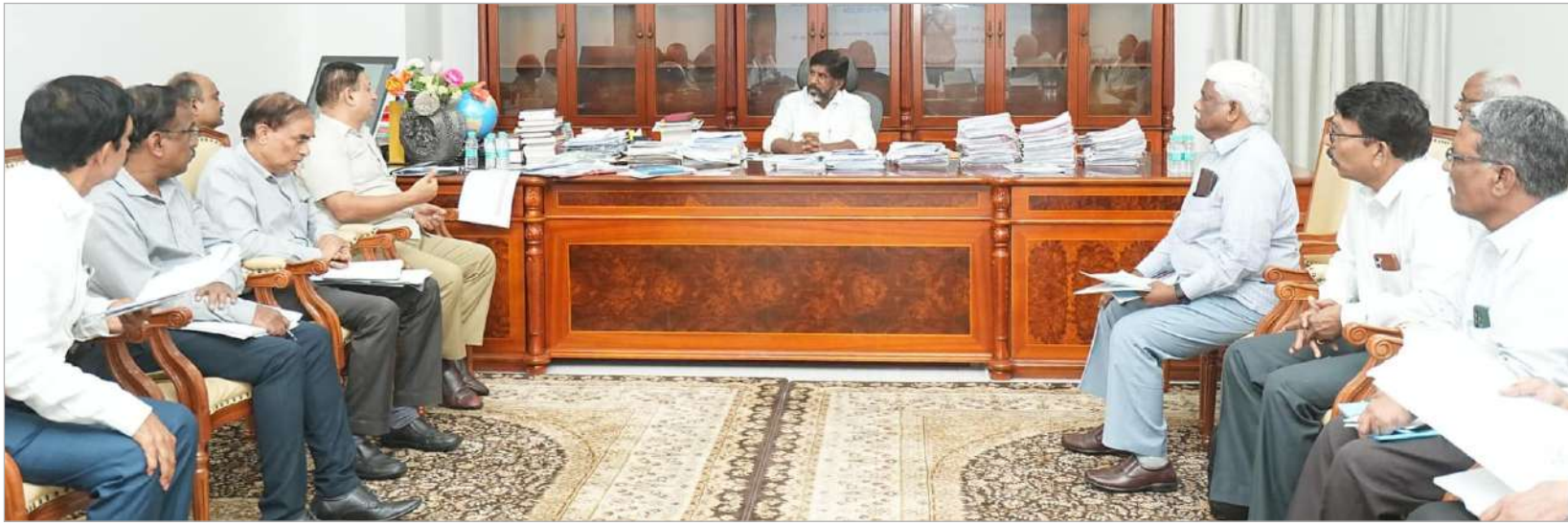
అన్నింటా జల విద్యుత్ ఉత్పత్తిని పెంచండి