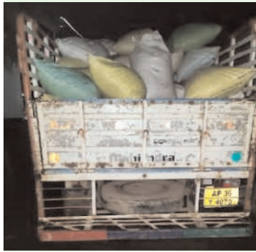
అన్నాడు ఈకార్యక్రమంలో పోలీస్ సిబ్బంది తదితరులు పాల్గొన్నారు

మహబూబాబాద్ జిల్లా కొత్తగూడ/ ఆగస్టు 24 (అక్షరం న్యూస్)