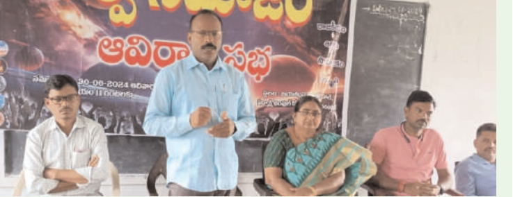
మహబూబాబాద్ /గార్ల /ఆగస్టు 24/అక్షరం స్వ్యాస్...