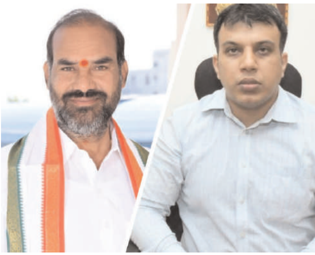
రాజన్న సిరిసిల్ల /వేములవాడ, ఆగస్టు - 24 (అక్షరం న్యూస్):

యువత సద్వినియోగం చేసుకోవాలి. ఎప్రభుత్వ విప్, వేములవాడ ఎమ్మెల్యే ఆది శ్రీనివాస్.