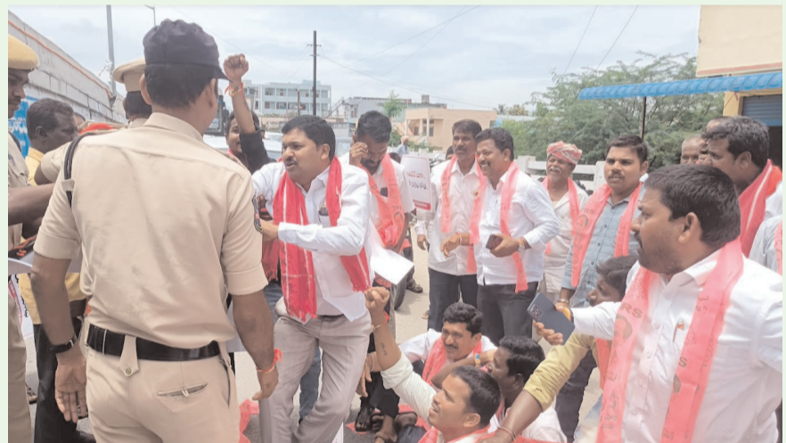
జనగామ జిల్లా/రఘునాథపల్లి/( అక్షరం స్టూన్ ) ఆగస్టు 22: