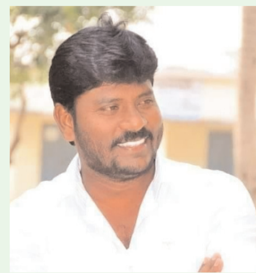
ఖమ్మం/వైరా ఆగస్టు 22 (అక్షరం స్టూన్):

మాట ఇస్తే తప్పని పార్టీ కాంగ్రెస్ పార్టీ..