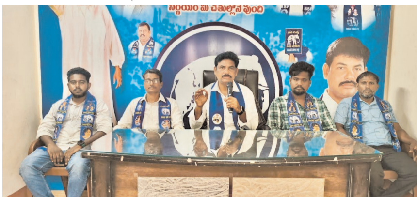
భద్రాద్రి జిల్లా/ కొత్తగూడెం/ ఆగస్టు 22/ అక్షరం న్యూస్:

సైడ్ కాలువను పునరుద్ధరించాలి - బీఎస్పీ రాష్ట్ర ప్రధాన కార్యదర్శి : యెర్రా కామేశ్వర్