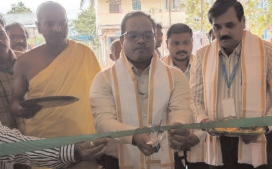
ములుగు/నూగూరు వెంకటాపురం/ఆగస్టు 22/ అక్షరం న్యూస్:-