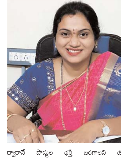
ద్వారానే పోస్టుల భర్తీ జరగాలని జిల్లా

భద్రాద్రి జిల్లా/కొత్తగూడెం /జూలై.11/అక్షరం న్యూస్: మెరిట్ ఆధారంగానే పోస్టులు భర్తీ జరుగుతుందని, జిల్లా ఉపాధి కల్పనాధికారిని వేల్పుల విజేత ఒక ప్రకటనలో పేర్కొన్నారు. ప్రభుత్వం మెడికల్ కళాశాలలో 155 పోస్టుల భర్తీ కొరత జిల్లా ఎంప్లాయిమెంట్ అధికారి నోటిఫికేషన్ విడుదల చేసిన సంగతి మీ అందరికీ తెలిసిందే. దాని కొరత 5,000 మంది కి పైగా అభ్యర్థులు దరఖాస్తు చేసుకున్నారు. మెరిట్ ఆధారంగా పోస్టులు భర్తీ చేయడానికి సమాయత్తమవుతున్న సందర్భంలో సంబంధిత ఏజెన్సీ వారు పోస్టుల భర్తీ కి సంబంధించిన నోటిఫికేషన్ ను జిల్లా ఎంప్లాయిమెంట్ అధికారి చేయరాదని, తమ ఏజెన్సీ