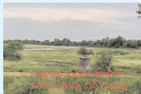
వర్షాలు కురవక ఖాళీగా కనపడుతున్న బీన్ చెరువు

ఓదెల/ పెద్దపల్లి (అక్షరం న్యూస్): ఓదెల మండలంలో దాదాపు 22 గ్రామాలలో జోరుగా వరినట్లు జరుగుతున్నాయి కానీ మూడు కార్వులు పోయిన సమృద్ధిగా వర్షాలు పడకపోవడంతో అన్నదాత దిగులు పడుతున్నారని కేవలం పునాస మందమే వర్షాలు కురవడంతో ఆనందపడాలి చెరువులో నీరు చేరక గావరపడడంతో అర్థం కావడం లేదని రైతులు ఆవేదన వ్యక్తం చేస్తున్నారు ముందస్తుగా రోహిణి కార్మిలోనే వర్షాలు పడడం కొంత రైతులను సంతృప్తి కలిగే విషయమే కానీ ఇప్పటివరకు పెద్ద వర్షాలు కురిసి ఏ చెరువులో కానీ నీరు చేరని పరిస్థితి చూసి అన్నదాత ఆగ మయ్యే పరిస్థితి కనబడుతుంది రోహిణి మృగశిల ఆరుద్ర పెద్దపల్లి ఇవే వర్షాకాలం బలమైన కార్వులు ఇప్పుడు వరకు సమృద్ధిగా వర్షాలు పడకపోవడంతో రైతులు ఇప్పుడిప్పుడే వరి నార్లు పోస్తున్నారని ప్రభుత్వం ప్రకటించిన సన్నబట్ల బోనమ్మ సన్న వడ్ల నాట్లు జోరుగా సాగుతున్నాయి రైతుకు ముందు చూస్తే నుయ్యి వెనక చూస్తే గొయ్యి లెక్క తయారైందని చెరువుల్లో వర్షపు నీరు ఉంటేనే బావులలో నీరు చేరి సమృద్ధిగా పంటలు వండుతాయని వర్షాలు పడకుంటే కాలేజ్యరం నీళ్లు లేక శ్రీరామ్ సాగర్ ప్రాజెక్టు నీరు వస్తాయి అనుకుంటే మేడిగడ్డ బ్యారేజీ ద్వారా కావడంతో నీళ్లు వచ్చే పరిస్థితి కనబడతలేవు అదేవిధంగా ప్రతి ప్రాజెక్టులో డెడ్ స్టోరేజీలు నీళ్లు ఉండడం చూసి ప్రభుత్వానికి కూడా కొంచెం కత్తి మీద సాము లాంటిది అని అర్థమవుతుంది చెరువుల నిండితనే రైతుకు ఆనందం కలుగుతుందని పలువురు రైతులు ఆవేదన వ్యక్తం చేస్తున్నారు.