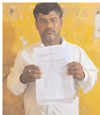
చంపుతామని తనను బెదిరించినట్లు పోలీస్ స్టేషన్