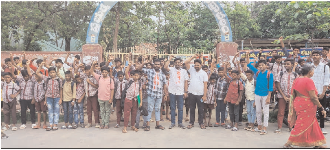
శ్రీ వైతన్య విద్యాలయంపై చర్యలు తీసుకోవాలి

దేశవ్యాప్తంగా విద్యార్థుల బంధుకు వామపక్ష అఖిలపక్ష విద్యార్థి సంఘాలు పిలుపునిచ్చిన సందర్భంలో భద్రాచలం పట్టణంలోని అన్ని ప్రభుత్వ ప్రైవేటు కళాశాలలు బంధుకు సంపూర్ణ సహాయ సహకారాలు అందించినప్పటికీ చర్చ రోడ్ లో ఉన్నటువంటి శ్రీ వైతన్య విద్యాలయంపై బండ్ ప్రకటించకపోవడమే కాకుండా విద్యార్థి సంఘాలు వెళ్లి బండ్ చేయాలని అడిగిన సందర్భంలో అక్కడ ఉన్న ట్రినిటీ విద్యార్థి సంఘ నాయకులపై ఇష్టానుసారంగా మాట్లాడుతూ దౌర్జన్యాలకు పాల్పడారని అలాగే శ్రీ వైతన్య విద్యాలయంపై తక్షణమే చర్యలు తీసుకోవాలని విద్యార్థి సంఘాలు డిమాండ్ చేశాయి. శ్రీ వైతన్య సూట్ నందు విచ్చలవిడిగా ఫీజులు దండుకోవడమే కాకుండా విద్యను వ్యాపారం చేస్తూ... పుస్తకాలు, నోట్స్ లు, టై, టెల్లు, ఇతర స్టేషనరీ అంత మా స్కూల్లోనే కొనాలి అని నిబంధన పెట్టడం జరిగింది విద్య హక్కు చట్టాన్ని తుంగలో తొక్కుతూ అధికారులను కూడా శాసించే స్థాయికి శ్రీ వైతన్య విద్యాలయంపై యాజమాన్యాల ఉన్యాయని భద్రాచలం ఏజెన్సీ ప్రాంతం అయినప్పటికీ అక్కడ ఉన్న చట్టాలను కూడా లెక్కచేయకుండా విద్య వ్యాపారం చేస్తున్నారని వారు తెలియజేశారు తక్షణమే శ్రీ వైతన్య విద్యాలయంపై ఉన్నతాధికారులు చర్యలు తీసుకోవాలని వారు ప్రభుత్వాన్ని డిమాండ్ చేశారు లేనియెడల దశల వారి పోరాటాలు శ్రీ వైతన్య విద్యాలయంపై నిర్వహిస్తున్నారని వారు తెలియజేశారు. బండ్ కు ప్రభుత్వ ప్రైవేటు విద్యాలయాల సంపూర్ణ సహకారం అందించారని వారు తెలియజేశారు. ఈ బంధుకు సహకరించిన విద్యార్థిని విద్యార్థులకు విద్యార్థుల తల్లిదండ్రులకు ప్రభుత్వ ప్రైవేటు యాజమాన్యాలకు విద్యార్థి సంఘ నాయకులు ధన్యవాదాలు తెలియజేశారు. ఈ కార్యక్రమంలో రవీంద్ర, చందు వర్మ, సురేష్, నాగకృష్ణ, తదితరులు పాల్గొన్నారు.