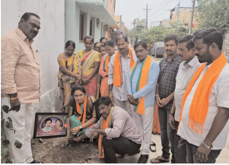
కీర్తి నగర్ జూలై 4 పెద్దపల్లి జిల్లా అక్షరం సూస్