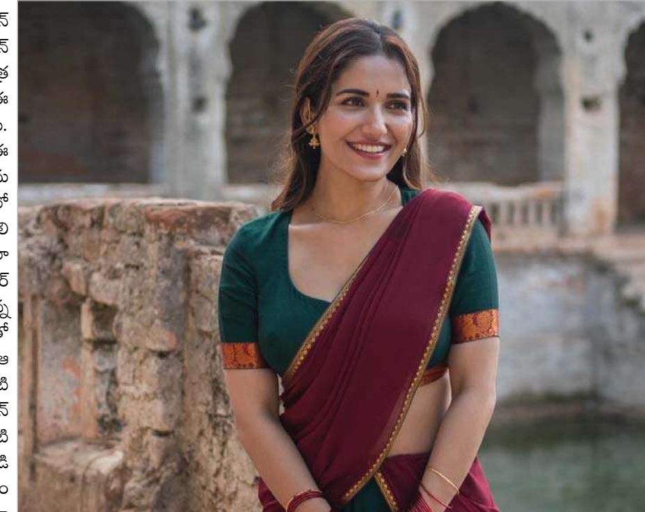
ఇప్పటికే తన గ్లామర్ షోతో, బోల్డ్ యాక్టింగ్తో తనకంటూ సవరేటు అభిమాన పర్సాన్ని సంపాదించుకున్న రుహానీ సోషల్ మీడియాలో చాలా యాక్టివ్గా ఉంటుంది.

రీసెంట్ గా స్టార్ అనే తమిళ సినిమాతో హిట్ కొట్టిన కెబిఎన్ తాజాగా నటిస్తున్న చిత్రం 'మూస్సో'. దిగ్గజ దర్శకుడు వెట్రిమారన్ నిర్మిస్తున్నారు.